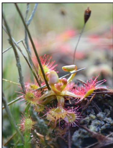
Рис. 1 D. rotundifolia