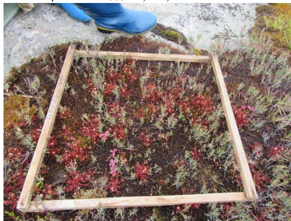
Рис. 4 Пробна площадка 0,5 *0,5