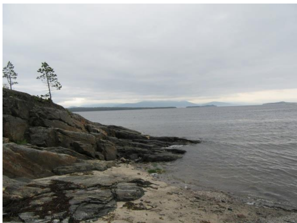
Рис. 3 Скалы участка № 2 о. Ряжков