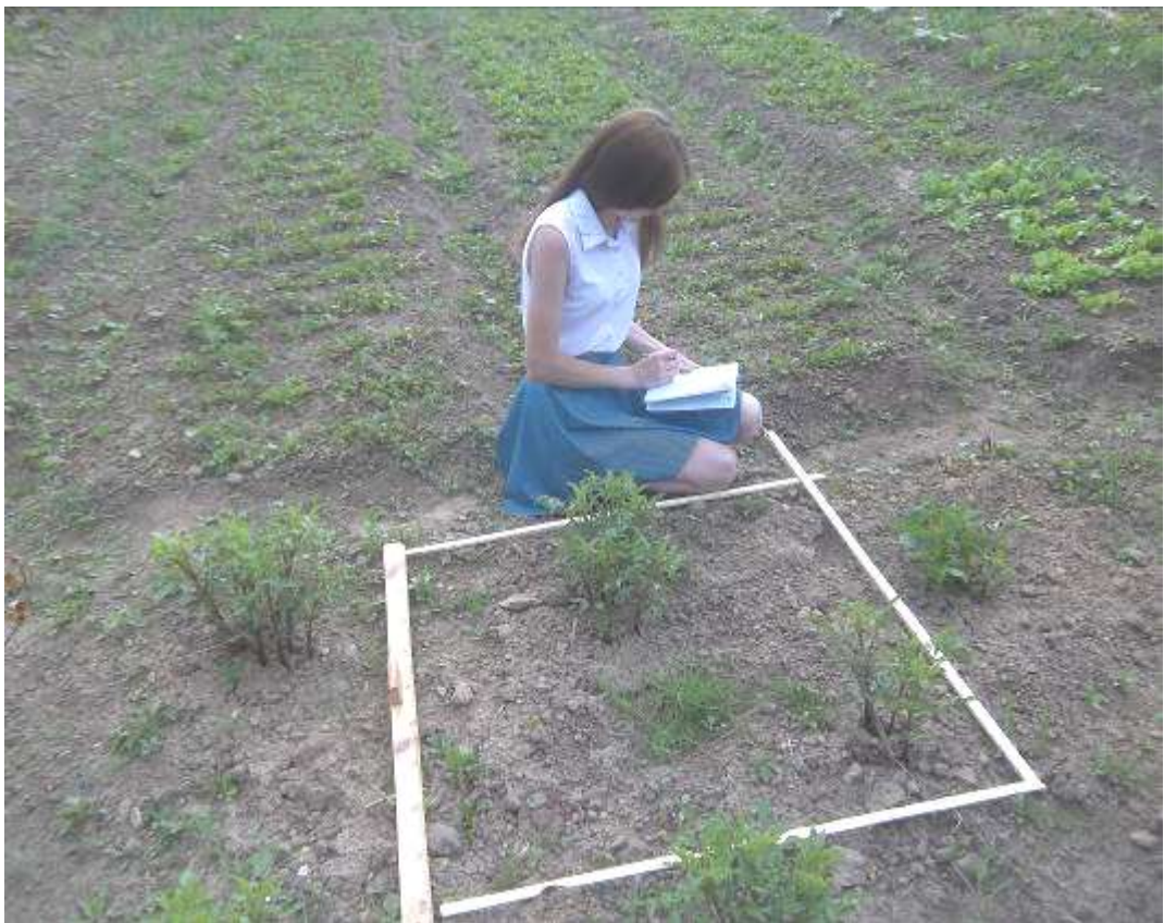
Учетная площадка №8