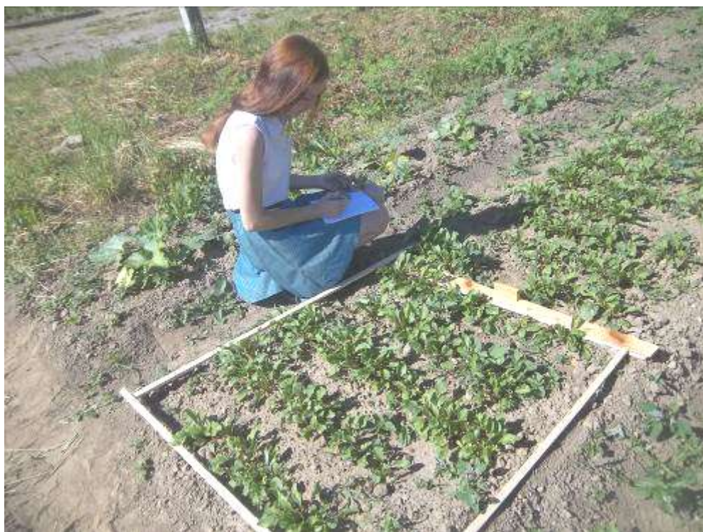
Учетная площадка №2