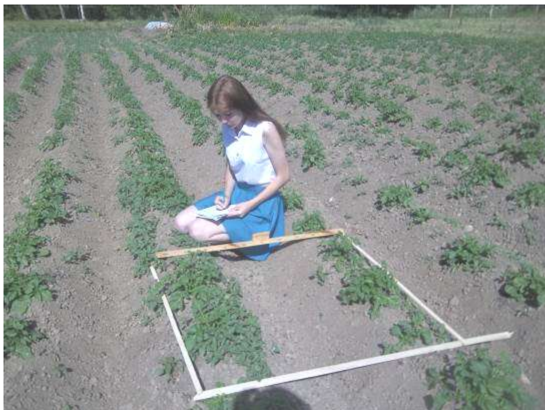
Учетная площадка №6