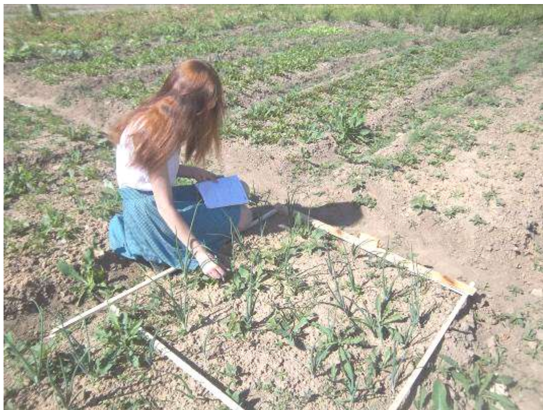
Учетная площадка №4