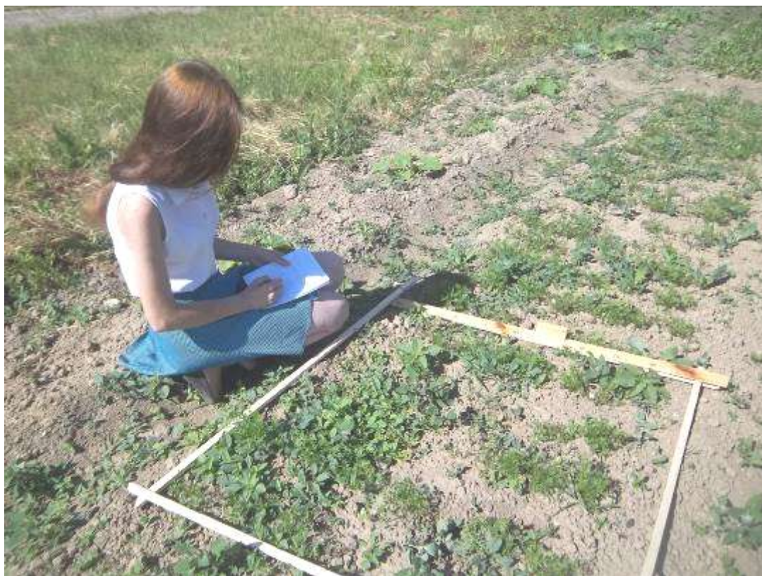
Учетная площадка №3