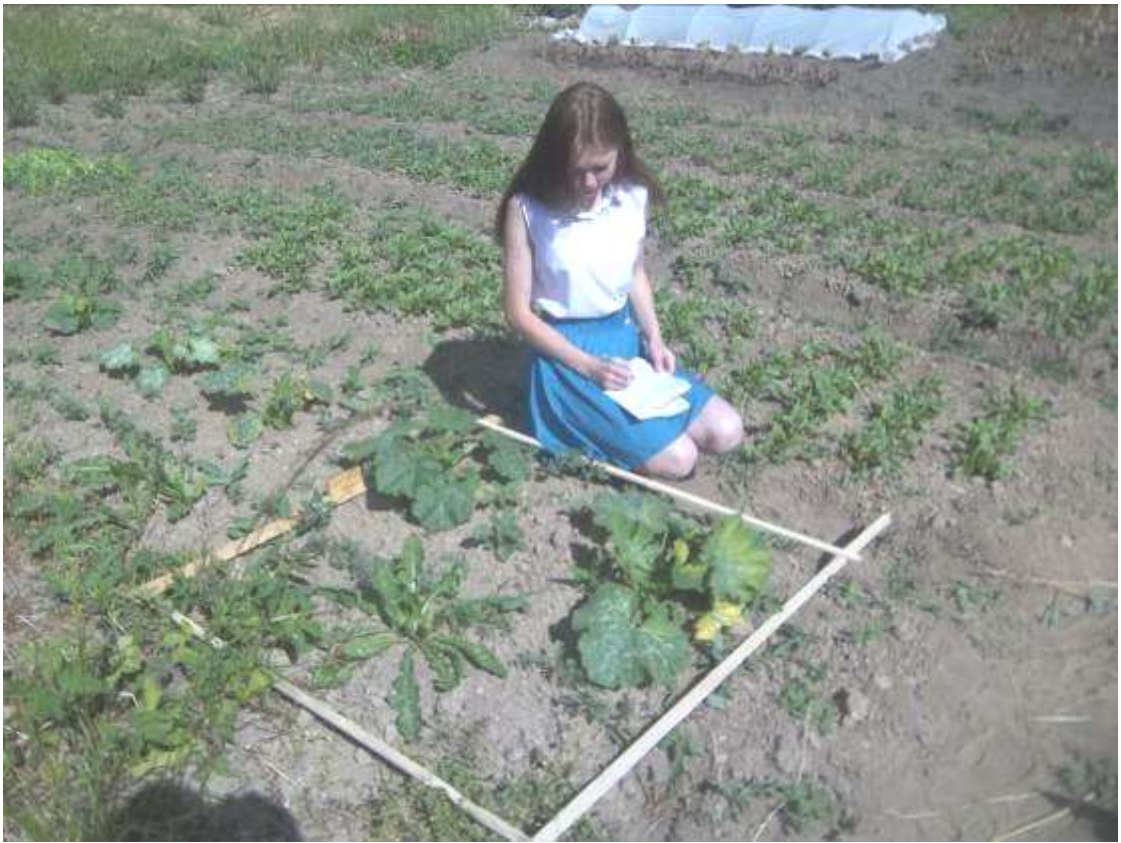
Учетная площадка №7