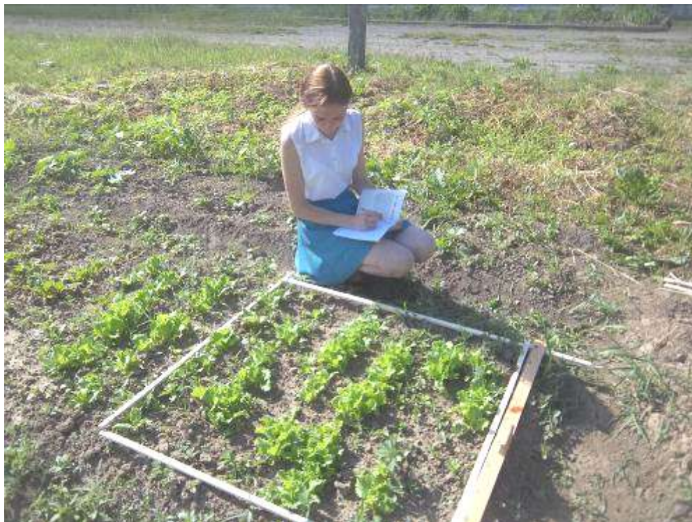
Учетная площадка №1