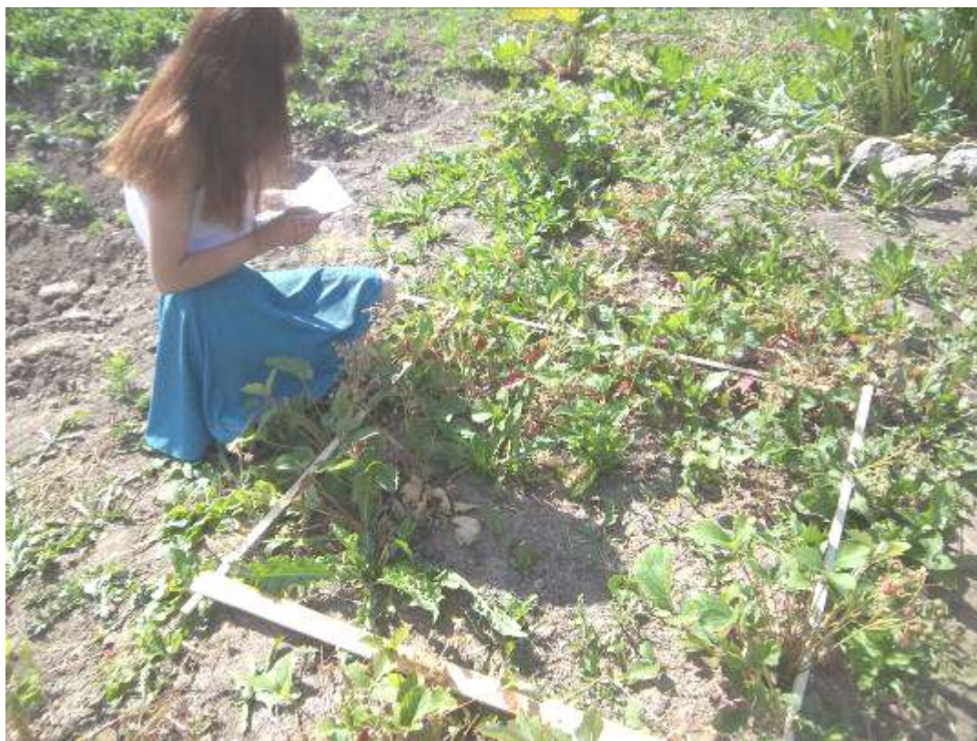
Учетная площадка №5