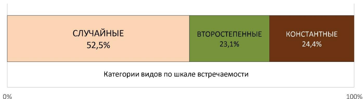
Рис. 4. Разделение фауны зообентоса бассейна р. Покши по шкале встречаемости

насчитывается 15, что составляет лишь 25,4% от общего состава видов (рис. 4). Их высокий показатель встречаемости говорит о их высокой толерантности, то есть способности выживать в разнообразных или изменяющихся условиях среды обитания.