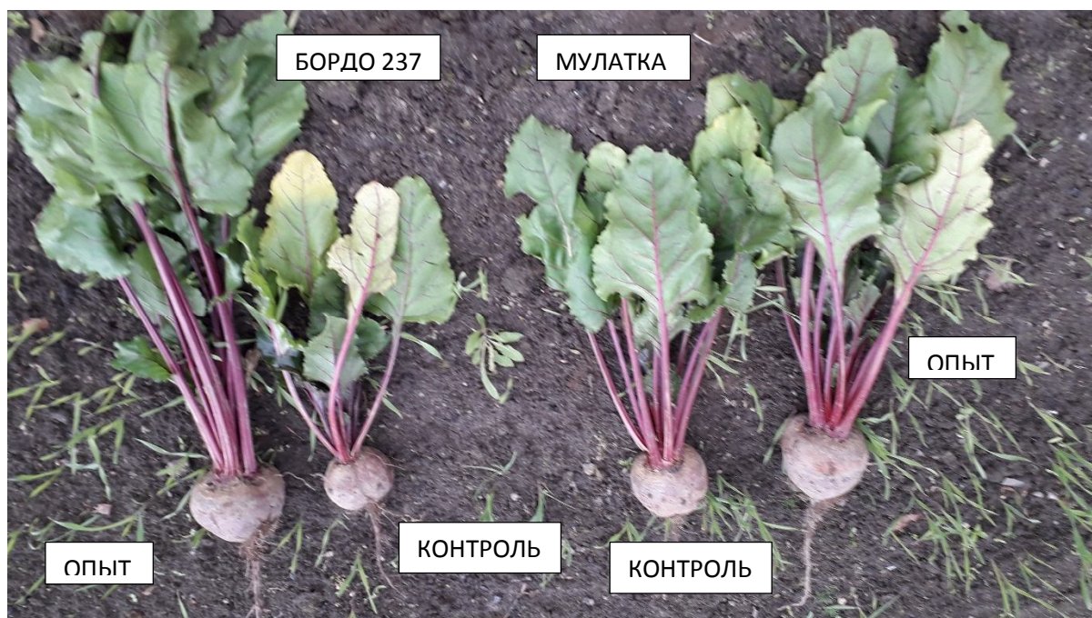
Фото 2. Биометрические показатели корнеплодов