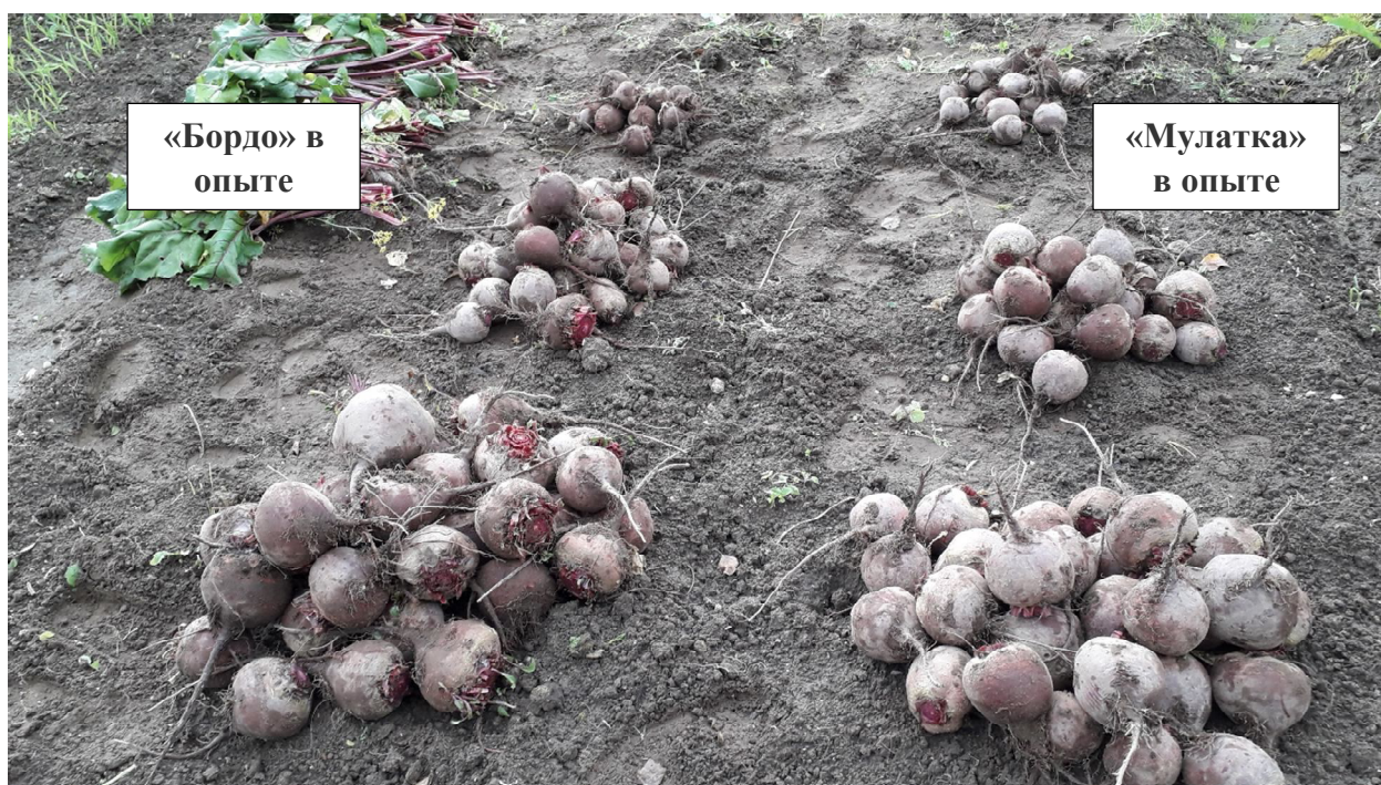
Фото 4. Результаты эксперимента. Контроль