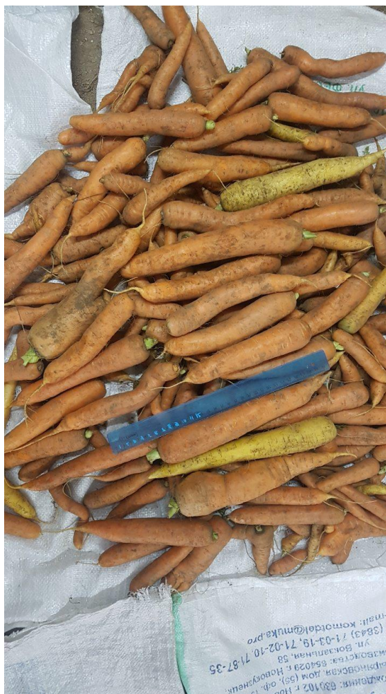
Рис. 5 – Морковь с грядки-контроля