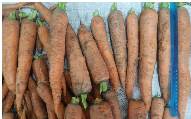
Рис. 3 – Морковь с опытной делянки, выращенная с применением гуминовых удобрений