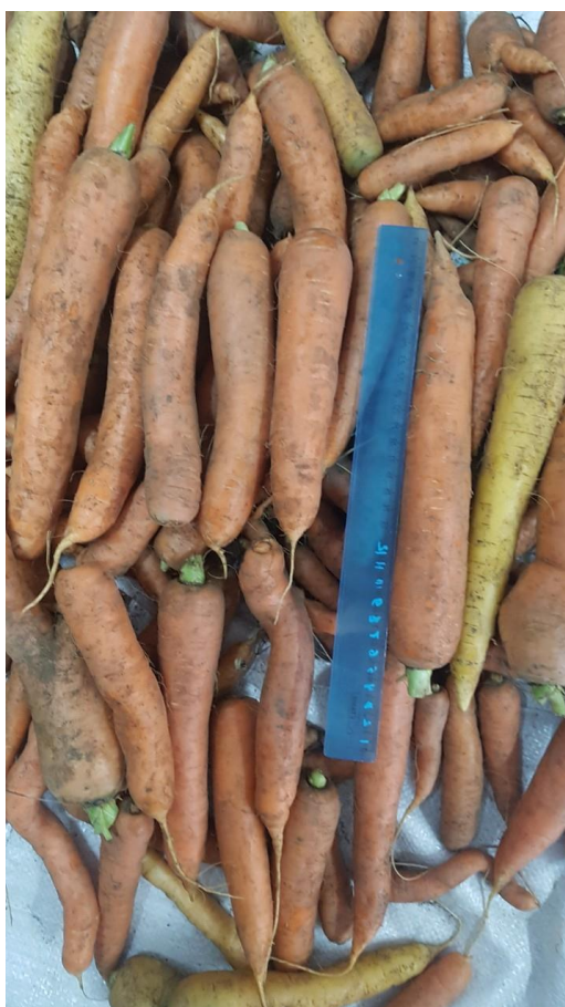
Рис. 4 – Морковь, выращенная с применением «Байкал-ЭМ1»