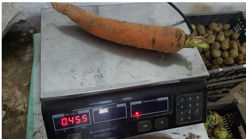
Рис. 6 - Крупная опытная морковь