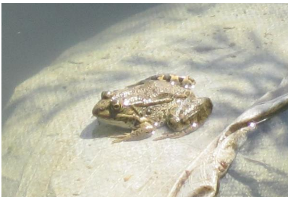
Рисунок 12 – Лягушка озёрная