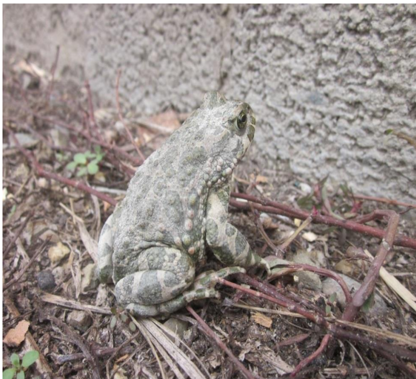
Рисунок 10 – Жаба зелёная (станция Удобная )

К наиболее широко распространенным представителям герпетофауны, следует отнести жабу зелёную (рисунок 10), лягушку озёрную (рисунок 12) и ящерицу прыткую восточную (рисунок 13), встречающихся практически повсеместно, включая трансформированные места обитания, в том числе территории населённых пунктов. А гадюка степная, наоборот, характеризуется спорадическим распространением.