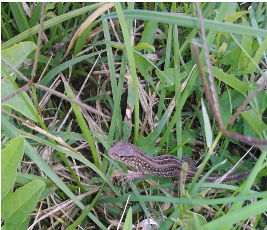
Рисунок 13 – Ювенильная особь восточной прыткой ящерицы (разнотравный луг)

Ужа обыкновенного (рисунок 14) отмечали, в основном, на поверхности водоёмов и у берегов, при этом были две находки особей на относительно большом расстоянии от водоёмов (300–600 м).