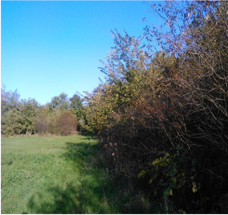
Рисунок 4 – Злаково-разнотравный луг в 1 километре от северо-восточной окраины станицы