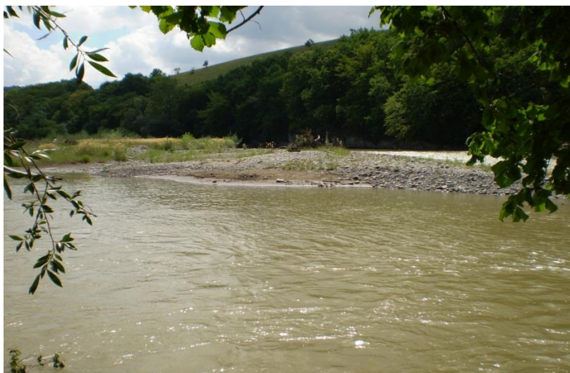
Рисунок 1 – Участок реки Уруп у юго-западной окраины станицы Удобной.

Исследования проводились на территории и в окрестностях станицы Удобной Отраденского района Краснодарского края. Время проведения наблюдений – с апреля по октябрь 2019 года, а так же апрель - август 2020 года. Окрестности станицы обследованы на протяжении около 7 км, а долина реки Уруп – около 4 км соответственно. В целях охвата исследованиями наибольшего разнообразия биотопов амфибий и рептилий были выбраны наиболее типичные и широко представленные на данной территории естественные и трансформированные элементы ландшафта. Обследованы наиболее типичные биотопы, в которых отмечены различные амфибии и рептилии.