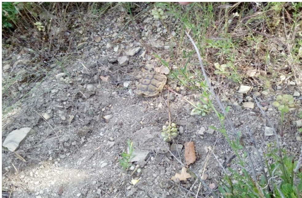
Рисунок 11 – Черепаха Никольского, найденная в окрестностях Новороссийск (Широкая балка), краевая школа экологов. Май 2019год.

Наиболее редки встречи медянки обыкновенной, а тритон Ланца в районе исследований известен лишь по одной находке.