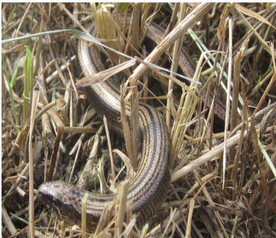
Рисунок 15 – Веретеница ломкая на суходольном лугу

Квакшу Шелковникова обычно наблюдали в огородах, на кукурузных полях. Вывод об обилии особей делали в основном исходя из вечернего характерного крика вокализирующих особей.