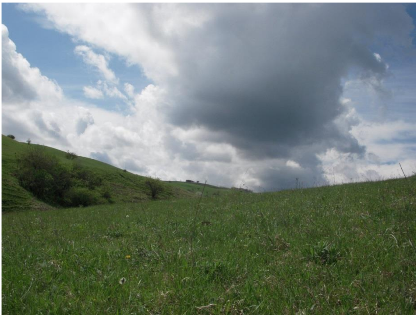
Рисунок 3 – Разнотравно-злаковый луг, ранее используемый для выпаса скота

Биотоп 2 – участок реки Уруп протяженностью 1000 м (рисунок 2), у западной окраины станицы. На большем протяжении маршрута берег имеет крутой склон. Людьюми посещается довольно редко. На участках с пологим склоном используется в качестве водопоя для скота.