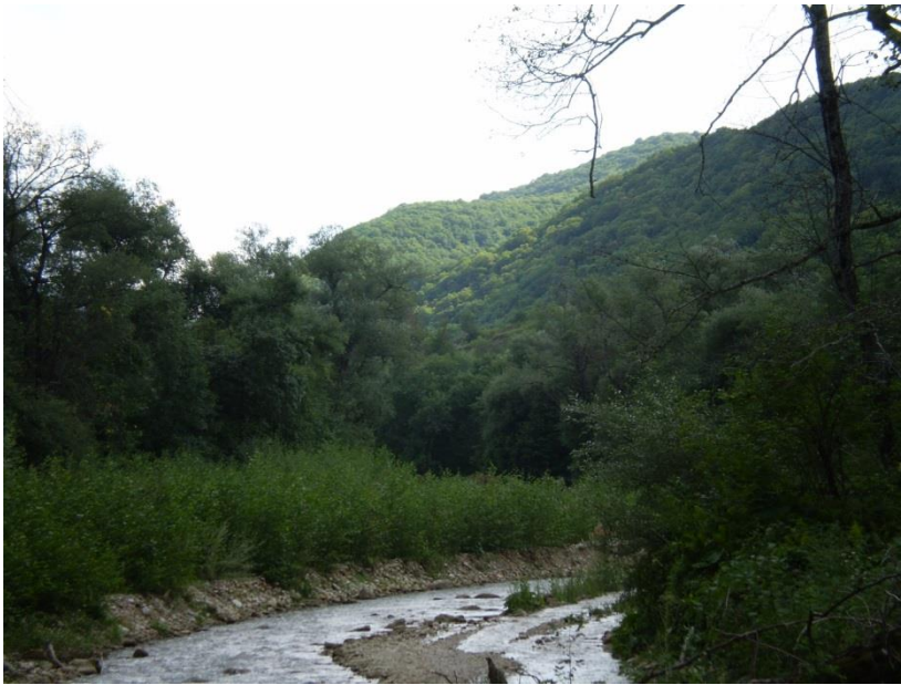
Рисунок 2 – участок реки Уруп протяженностью 1000 м

Биотоп 2 – участок реки Уруп протяженностью 1000 м (рисунок 2), у западной окраины станицы. На большем протяжении маршрута берег имеет крутой склон. Людьюми посещается довольно редко. На участках с пологим склоном используется в качестве водопоя для скота.