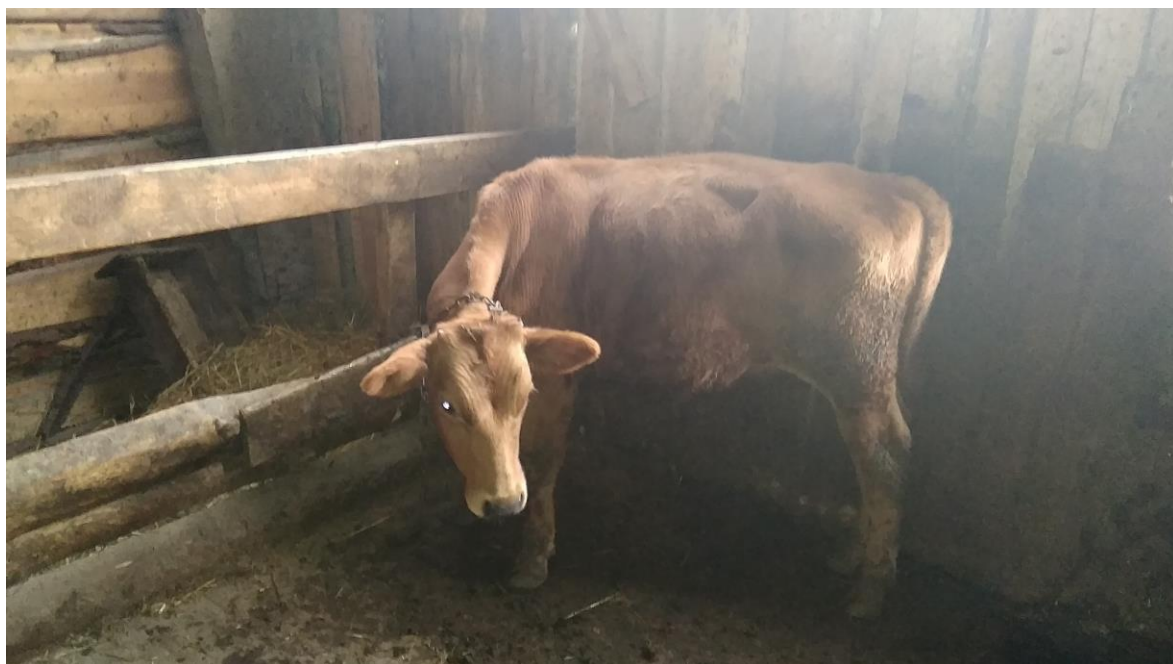
Рис.3. Бычок аборигенной породы.