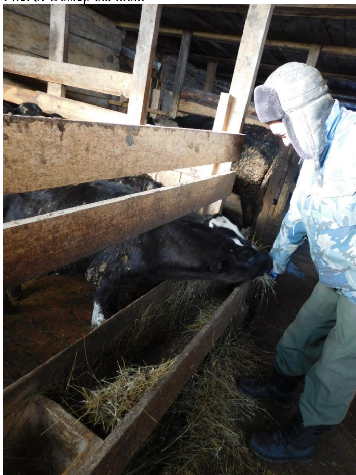
Рис.6. Кормление животных.