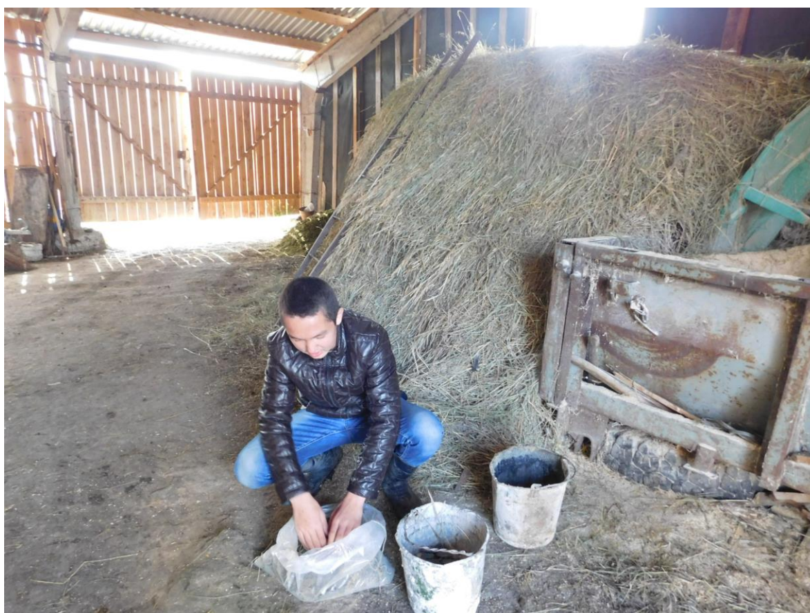
Рис. 4. Подготовка комбикорма.