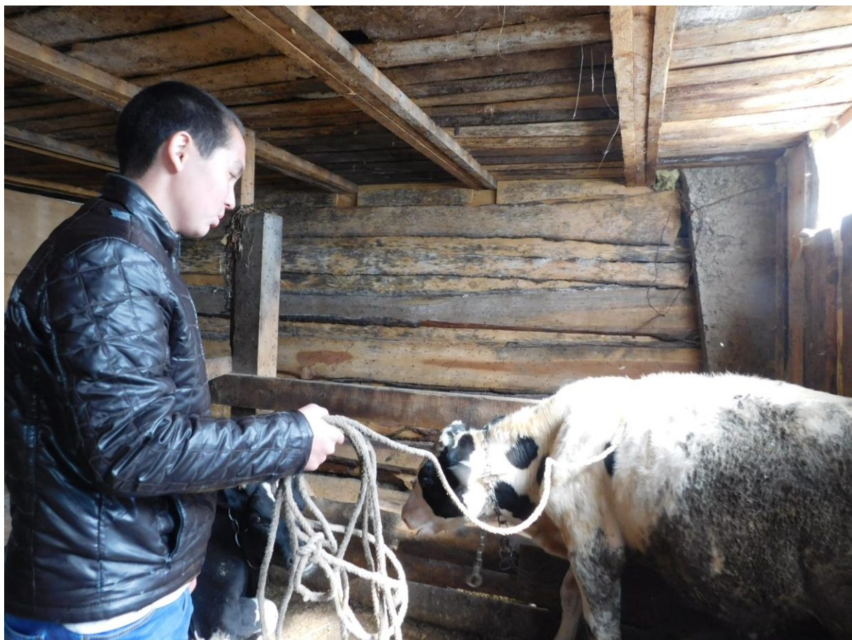
Рис. 5. Обмер бычков.