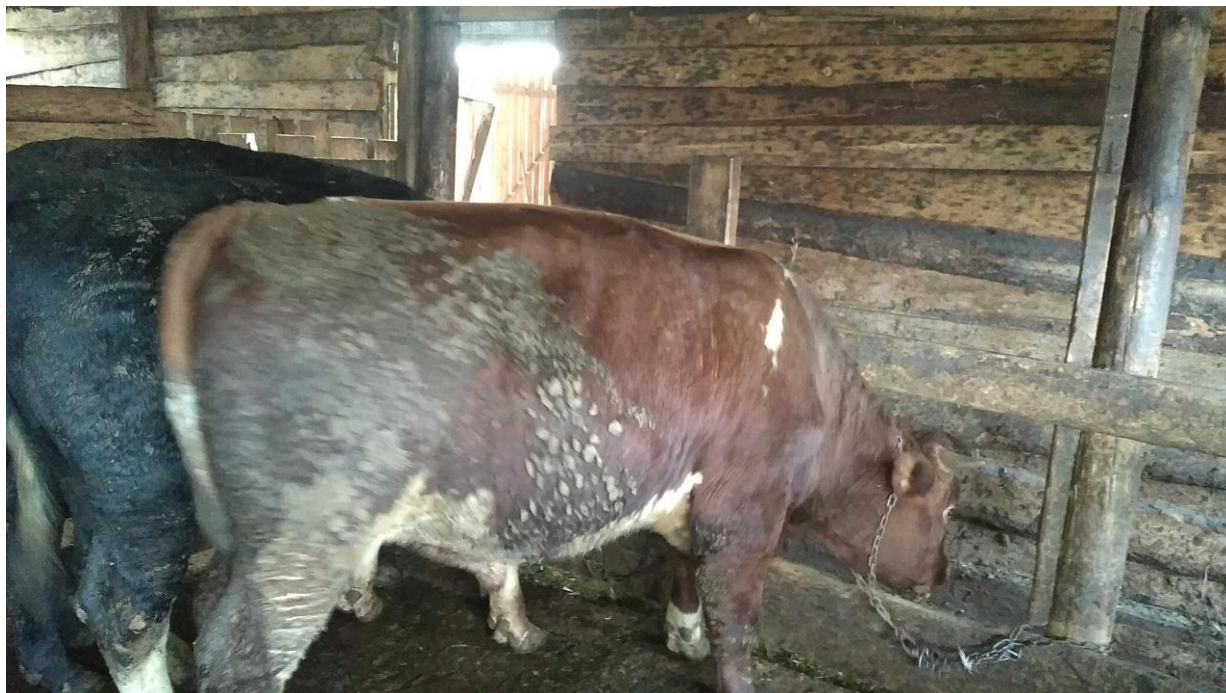
Рис.1. Бычок красно-степной породы.