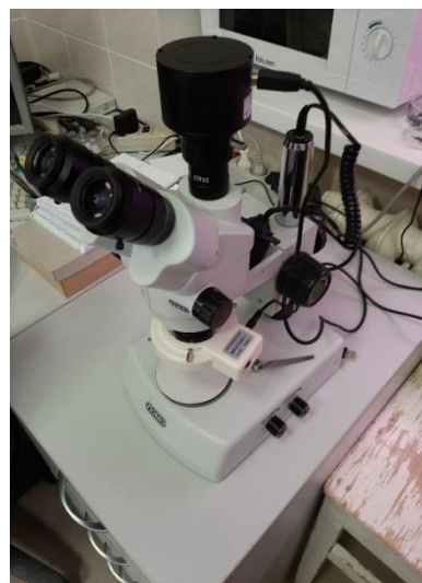
Рис. 3. Бинокулярный микроскоп ЛОМО

Кроме того, выполнено сравнение размеров клеток и формы выращенных разрастаний с живыми штаммами из коллекции водорослей Института биологии Коми НЦ УрО РАН (рис. 4-6).