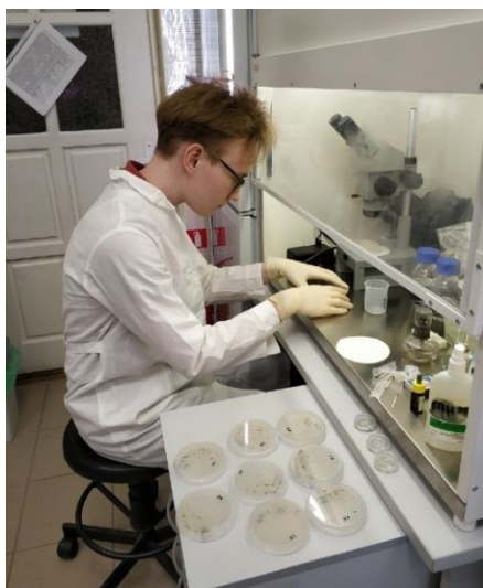
Рис. 2. Просмотр чашек Петри с образцами в ламинарном боксе

В течение двенадцати недель культивирования еженедельно просматривали образцы N. commune , оценивали жизнеспособность клеток и колоний (рис. 2). Жизнеспособность – способность особи сохранять свое существование в меняющихся условиях окружающей среды. Исследование образцов проводили на бинокулярном микроскопе ЛОМО (рис. 3) при увеличении в \times 50 , \times 100 раз.