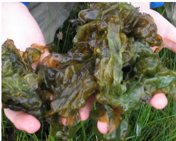
Рис. 1. Колония N. commune в природных условиях

N. commune образуют колонии с крепким перидермом, по мере роста сначала шаровидные, затем имеют вид плоско-распростёртых слоевищ, до нескольких десятков сантиметров в поперечнике, складчатые или волнистые, тёмной, иногда почти чёрной окраски (рис. 1). Нити тесно переплетающиеся, 4-6 мкм ширины, бледнооливково-зелёной окраски. Гетероцисты почти шаровидные, около 7 мкм в диаметре. Споры такой же величины, как и вегетативные клетки с гладкой бесцветной оболочкой, очень редкие (Голлербах, Косинская, 1953).