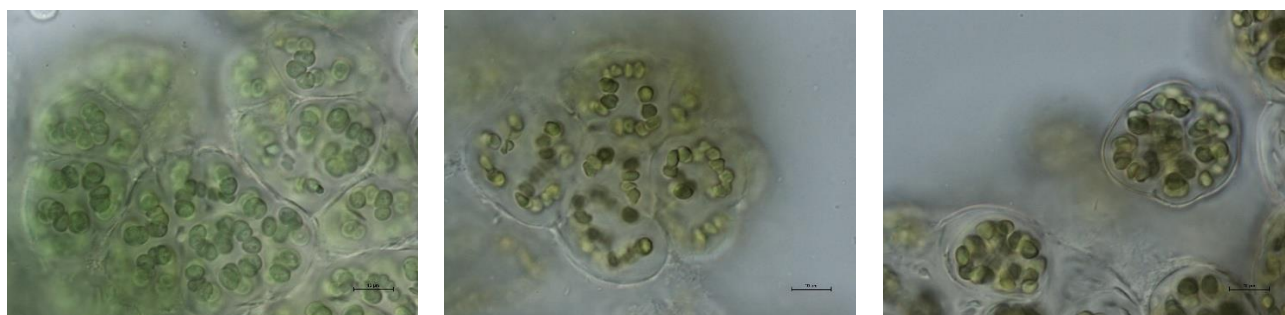
Рис. 4-6. Разные штаммы N. commune : молодые колонии и клетки

Кроме того, выполнено сравнение размеров клеток и формы выращенных разрастаний с живыми штаммами из коллекции водорослей Института биологии Коми НЦ УрО РАН (рис. 4-6).