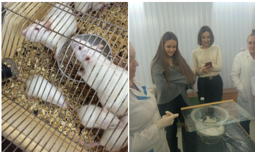
Рисунок 2 – Виварий Пензенского ГАУ

Животных отбирали по принципу аналогов с учетом пола, возраста и живой массы тела. В период проведения исследований поддерживали одинаковые условия кормления и содержания опытных и контрольных животных.