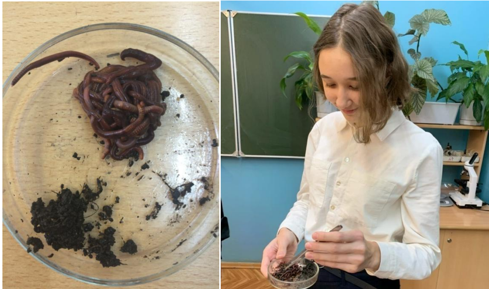
Рисунок 3 – Образование наносов на дождевых червях после нахождения на свету и их удаление

Следующей стадией подготовки препарата является погружение дождевых червей в раствор органической кислотой в течение 30 секунд при рН в пределах от 2 до 5 (рис. 4) и дальнейшая промывка водой. В момент погружения в условия непривлекательной среды обитания, созданной с использованием органической кислоты, дождевые черви вынуждены выводить остатки содержимого пищеварительного тракта и выделить аммиак.