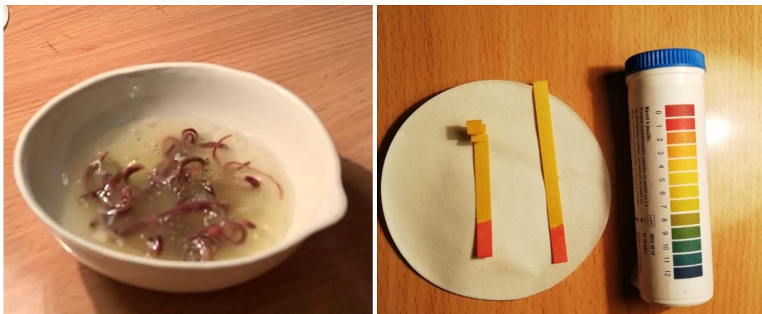
Рисунок 4 – Очищение дождевых червей в щавелевой кислоте

Следующей стадией подготовки препарата является погружение дождевых червей в раствор органической кислотой в течение 30 секунд при рН в пределах от 2 до 5 (рис. 4) и дальнейшая промывка водой. В момент погружения в условия непривлекательной среды обитания, созданной с использованием органической кислоты, дождевые черви вынуждены выводить остатки содержимого пищеварительного тракта и выделить аммиак.