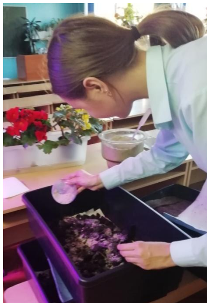
Рисунок 1 – Разведение дождевых червей в вермикомпостере

Анализ массы дождевых червей проводили в ЦАС «Пензенский» по аккредитованным методикам.