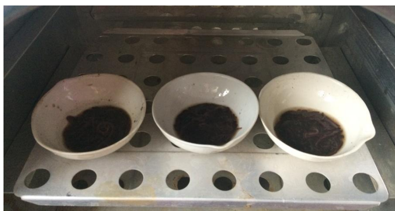
Рисунок 5 – Сушка дождевых червей после замораживания

Общеизвестно, что обычно ферменты неустойчивы к нагреванию, за исключением ферментов в некоторых термофильных бактериях, и поэтому проводилась термообработка при температуре 80^{\circ}\text{C} (рис. 5).