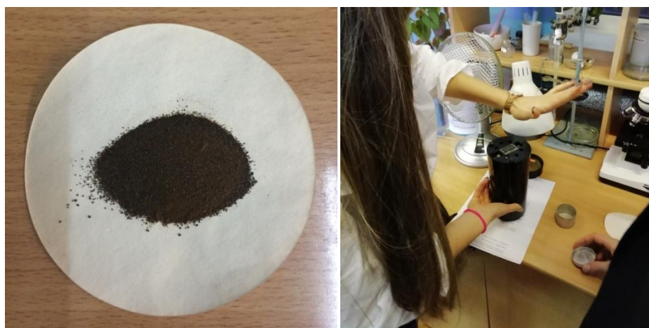
Рисунок 6 – Получение порошка из высушенной массы

Высушенную массу измельчали на электромельнице и получили сухой очищенный порошок из дождевых червей (рис. 6).