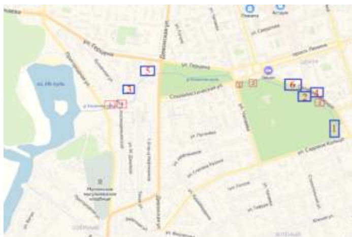
Рис. 2. Схема окрестностей р. Уксынлы-куль на территории г. Октябрьский РБ