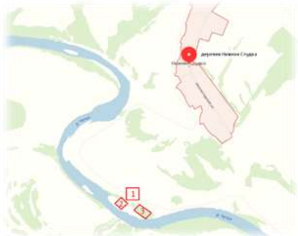
Рис. 1. Схема окрестностей реки Чепцы Глазовского района УР

В качестве объектов исследования были выявленные инвазивные виды: Heracleum sosnowskyi Manden, Impatiens glandulifera Royle, Echinocystislobata (Michx.) Torr. Et. A. Gray, Acer negundo L., как произрастающие в поймах исследуемых рек инвазивные виды, трансформирующие сообщества пойм. Для характеристики фитоценозов, в состав которых входили изучаемые виды, были сделаны геоботанические описания с учетом проективного покрытия.