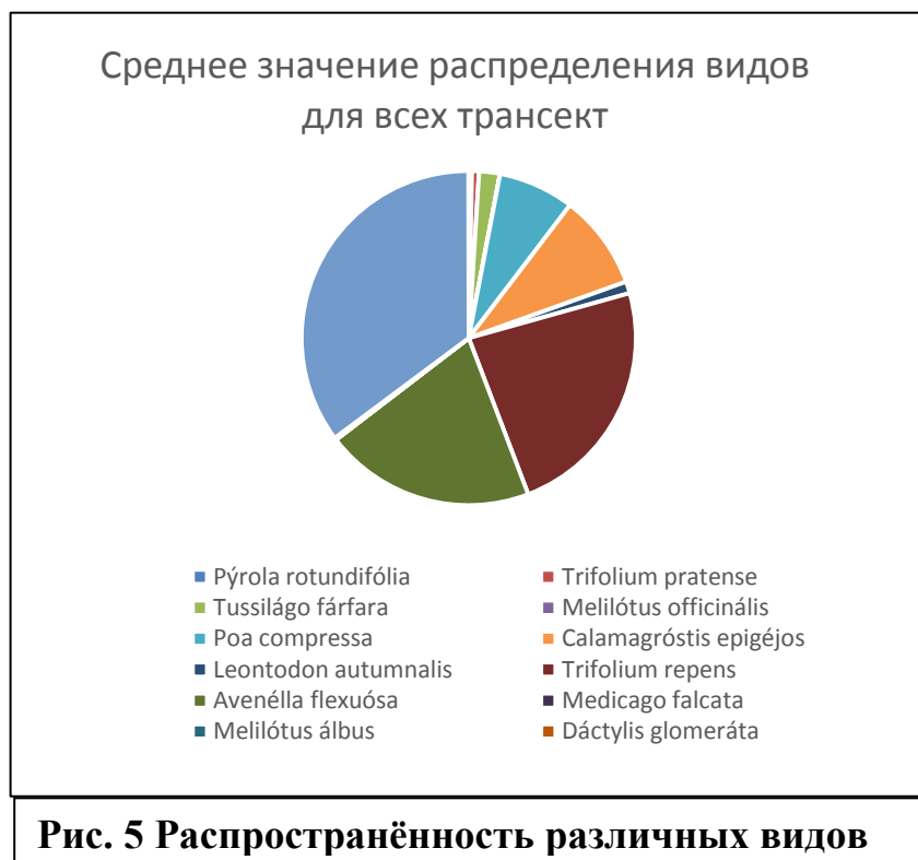
Рис. 5 Распространённость различных видов

Из приведённой градации видно, что наша гипотеза о влаголюбивости и неприхотливости оказалась преимущественно верна, однако, не во всех случаях: все перечисленные выше виды малотребовательны к содержанию гумуса и минеральных веществ и способны произрастать на обеднённых почвах. В некоторой мере они являются гелиофитами, что возможно из-за крайне незначительно развитых верхних ярусов. Многие из них влаголюбивы ( Trifolium repens ), однако некоторые ( Festuca rubra ), напротив, предпочитают более засушливые территории. Это может объясняться тем, что глинистый