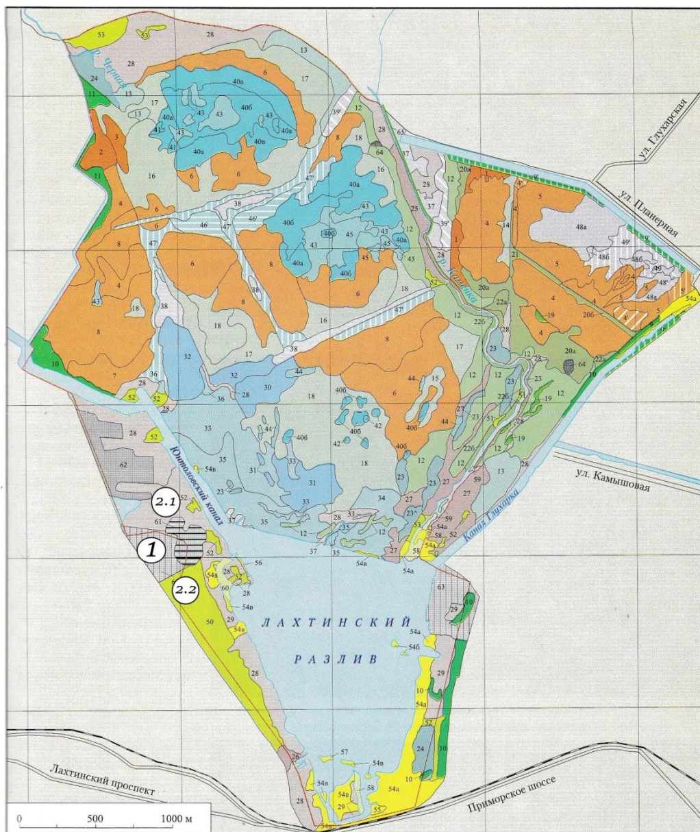
Рис. 3 Исследуемая территория (1) и биотопы, окружающие её (2.1; 2.2)

Территории заказника на протяжении многих лет подвергались значительному воздействию человека. С приближением городских кварталов влияние человека на среду продолжает расти. К таким воздействиям можно отнести, например, загрязнение атмосферного воздуха, многолетнюю осушительную мелиорацию, рекреационную эксплуатацию, техногенное воздействие.