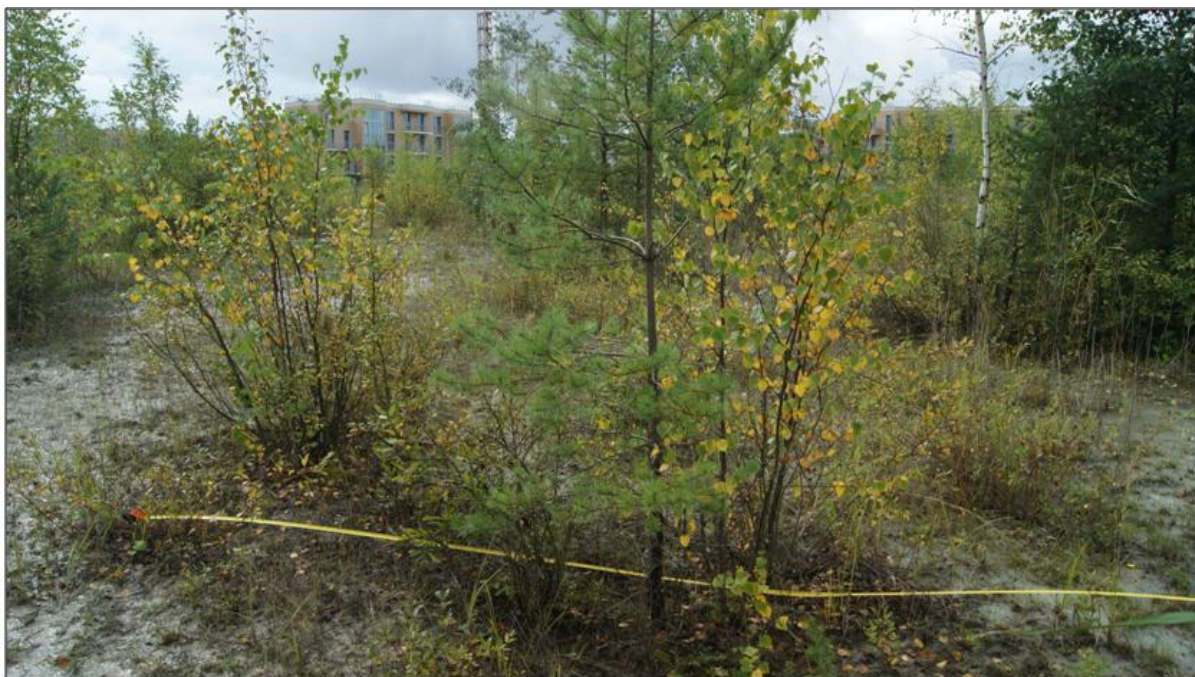
Рис. 1 Близость города к территориям заказника

К сожалению, такое близкое расположение к большому городу, а на данный момент даже нахождение в его пределах, оказывает огромное влияние на природу заказника. Высокая рекреационная нагрузка, загрязнение и техногенное воздействие резко неблагоприятно сказываются на экосистемах заказника.