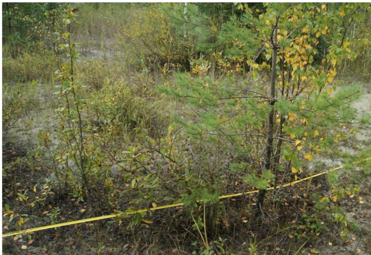
Рис. 6 Деревья в центрах очагов заселения

Зафиксированную вариативность распределения видов относительно центра очага заселения можно обосновать тем, что для части представленных таксономических единиц более характерны менее богатые почвы, исключаящие какую-либо конкуренцию, а другие виды напротив более требовательны к грунту и попросту не могут выжить на периферии, зато они более устойчивы к конкуренции. Наиболее ярко такая тенденция выражена у деревьев (рис. 6) Это показывает полное соответствие нашей гипотезы о концентрическом росте реальности. Так же в этом можно убедиться по картам (рис.7).