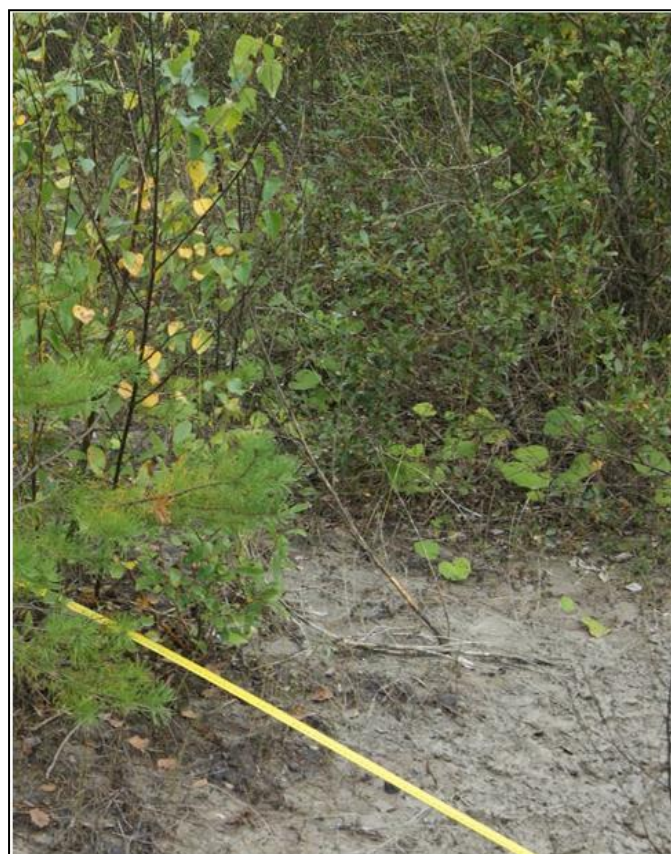
Рис.4 Tussilago farfara на изучаемой территории

растительности. Этот вид относится к видам-пионерам и преимущественно предпочитает как раз глинистые почвы. Она не встречается в близлежащих биотопах и вообще её присутствие не свойственно в таких местах, однако, условия, образовавшиеся после тяжёлого антропогенного воздействия сложились крайне благоприятны для её расселения.