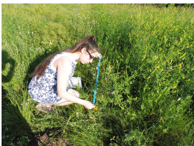
Рис. 5. Измерение растений майкарагана волжского