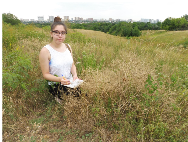
Рис. 6. Измерение морфометрических показателей катрана