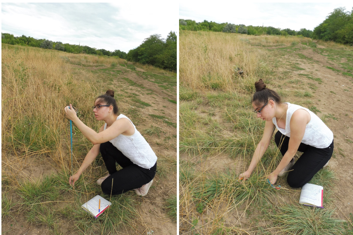
Рис. 9, 10. Измерение морфометрических показателей ломкоколосника СИТНИКОВОГО