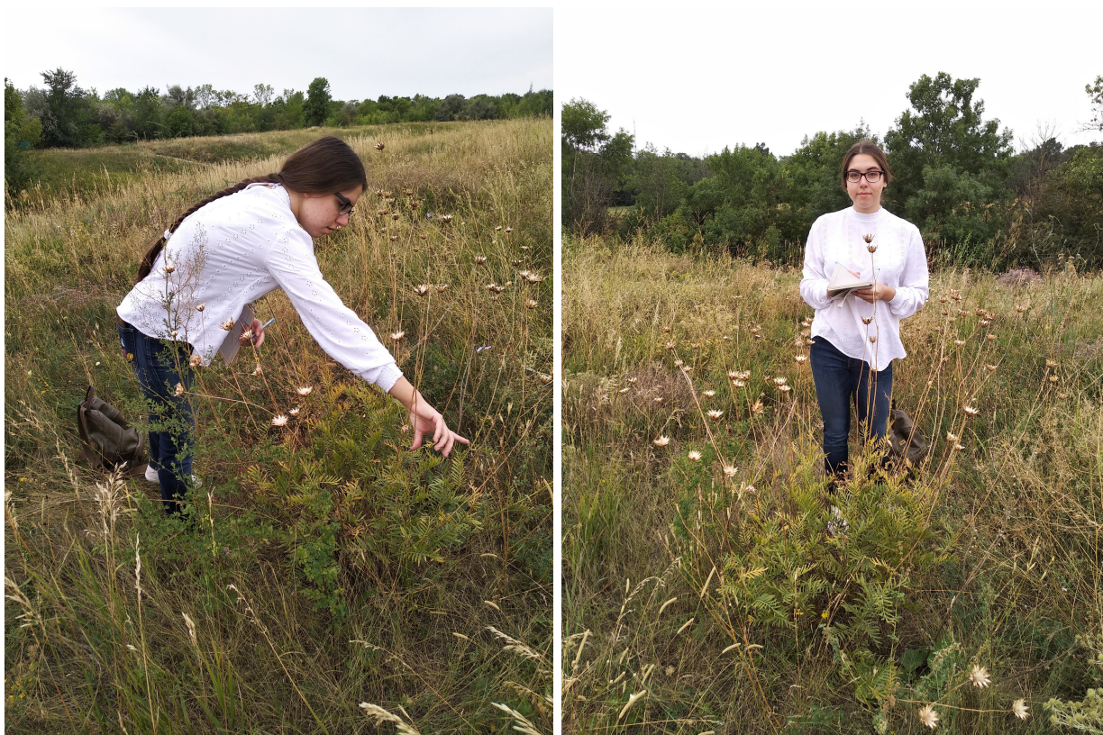
Рис. 7, 8. Подсчёт числа соцветий на цветоносный побег василька русского