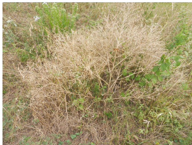
Рис. 3, 4. Катран татарский на степном склоне балки (стадия плодоношения)