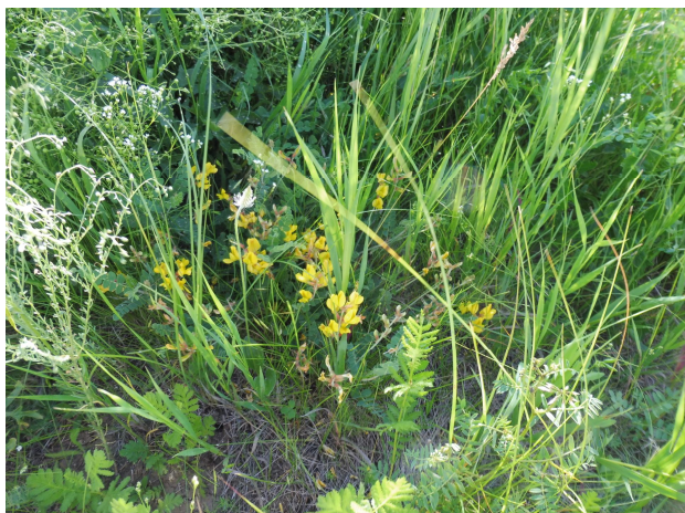
Рис. 1. Майкараган волжский на участке искусственной степи