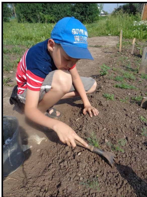
Рисунок 9. Рыхление междурядий