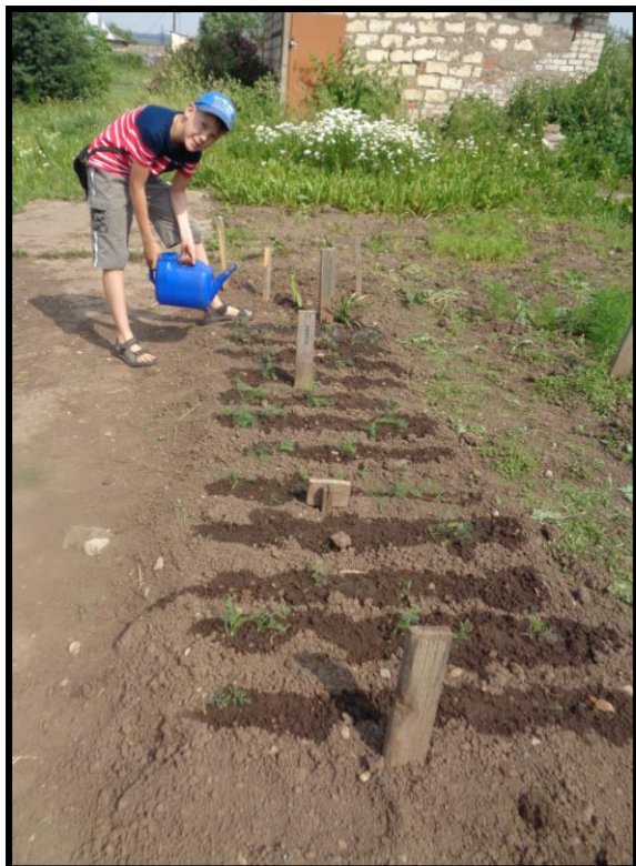
Рисунок 8. Полив растений укропа