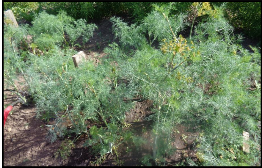
Рисунок 14. Делянки с укропом перед вторым сбором урожая