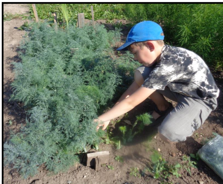
Рисунок 12. Первый сбор урожая