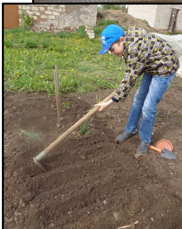
Рисунок 3. Подготовка делянок к посеву семян укропа