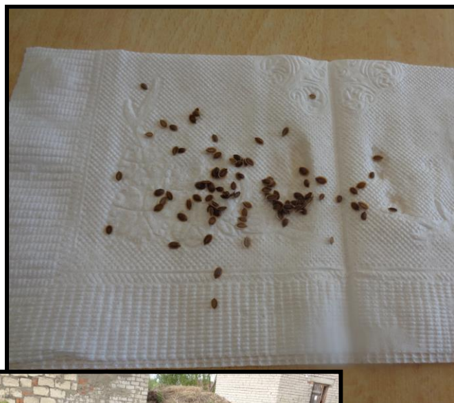
Рисунок 2. Подсушивание семян укропа перед посевом