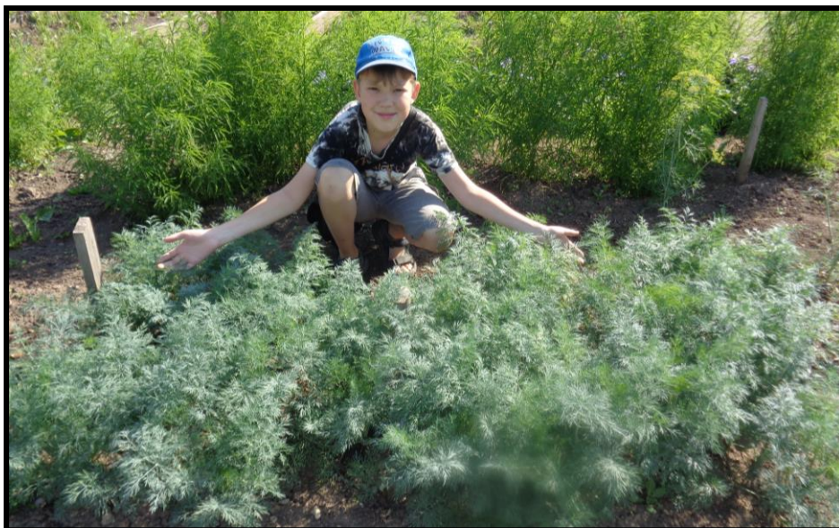
Рисунок 11. Экспериментальные делянки