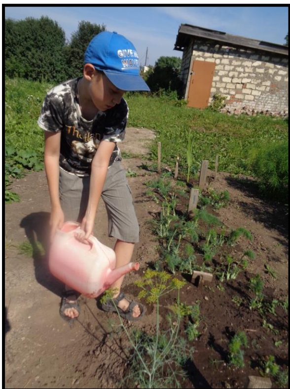
Рисунок 10. Подкормка растений укропа удобрением после сбора урожая