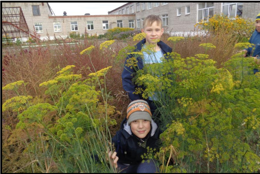
Рисунки 15 - 16. Делянки с растениями укропа в сентябре 2018 г