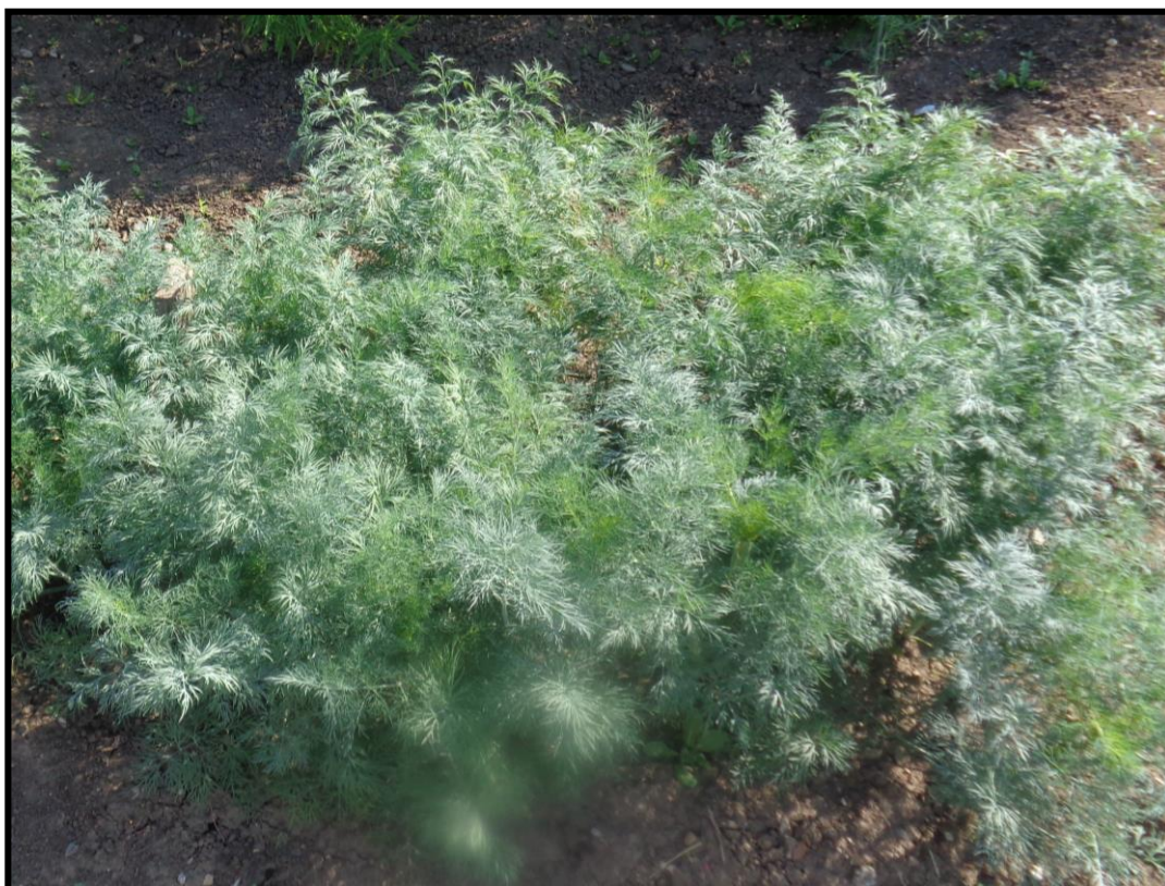
Рисунок 1. Растения укропа сорта 'Амазон'

Рекомендуется для сушки, замораживания, приготовления разнообразных приправ, засолки и маринования.