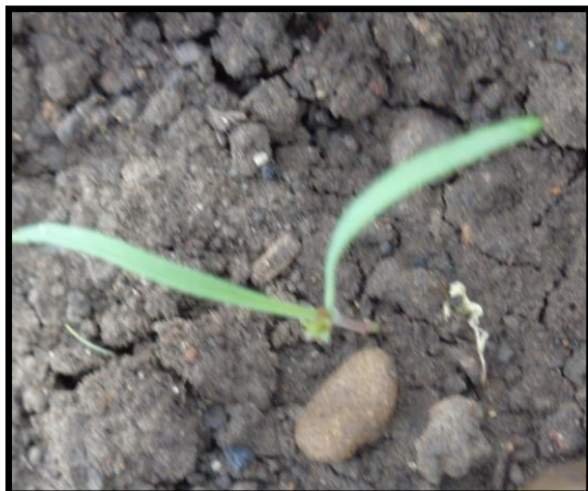
Рисунок 5. Появление проростков