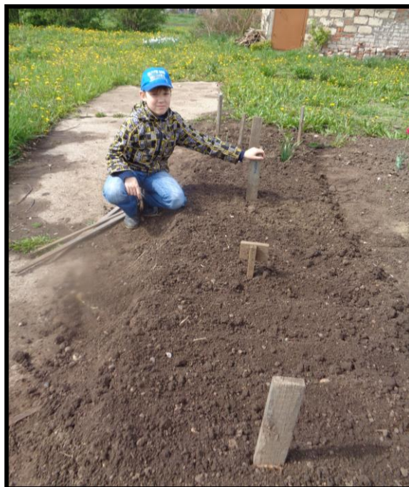
Рисунок 4. Экспериментальные делянки с растениями укропа