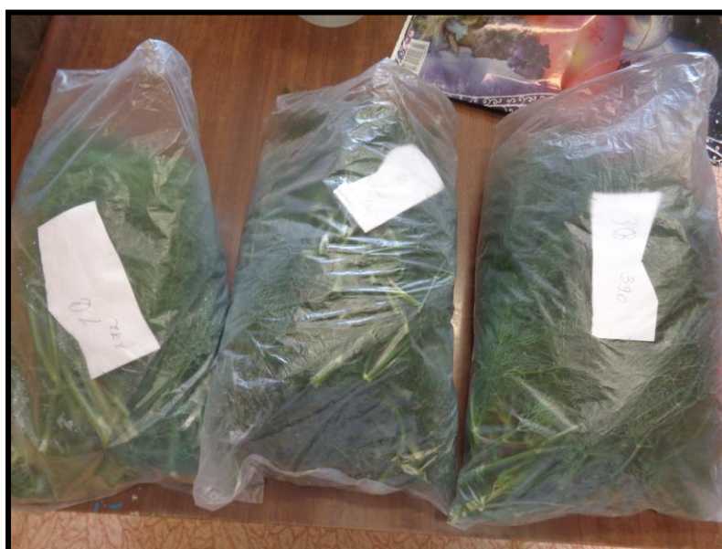
Рисунок 13. Урожай укропа по вариантам