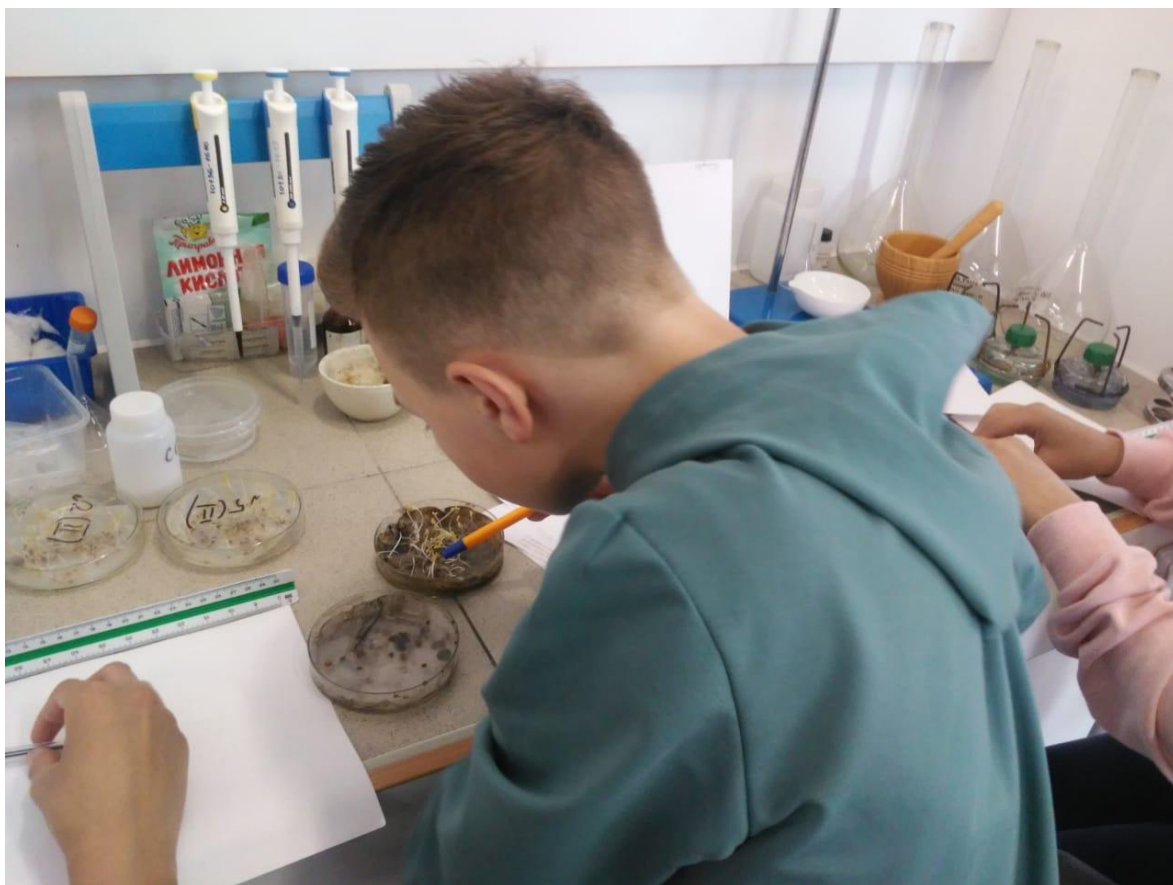
Подсчёт и оценка роста кресс салата.