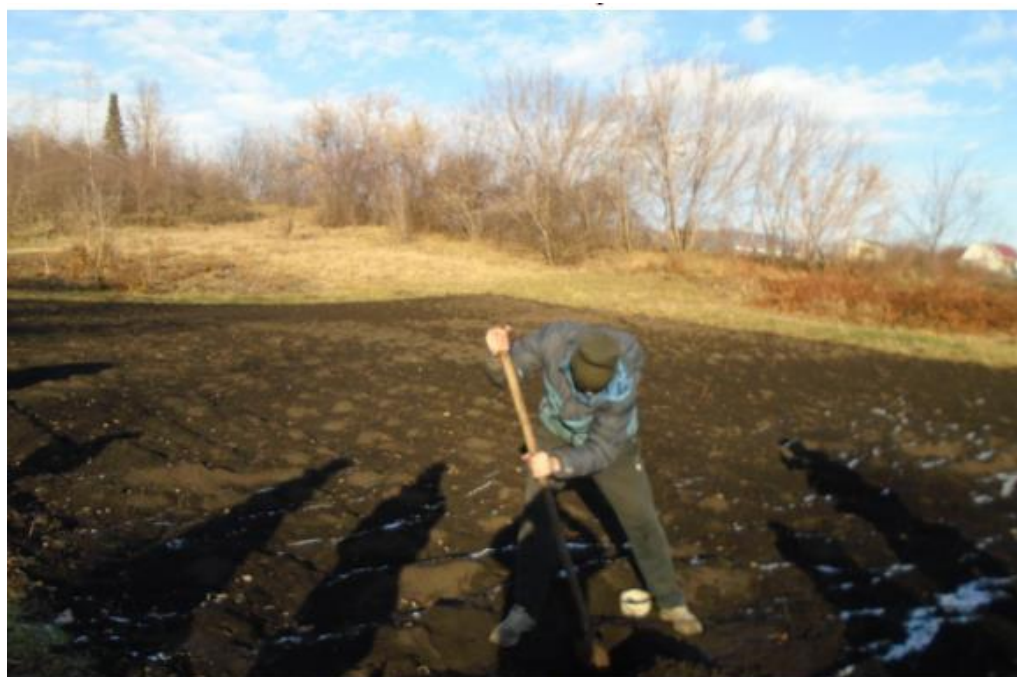
Производственный отдел эколого-биологического отдела, базы Кванториума-04