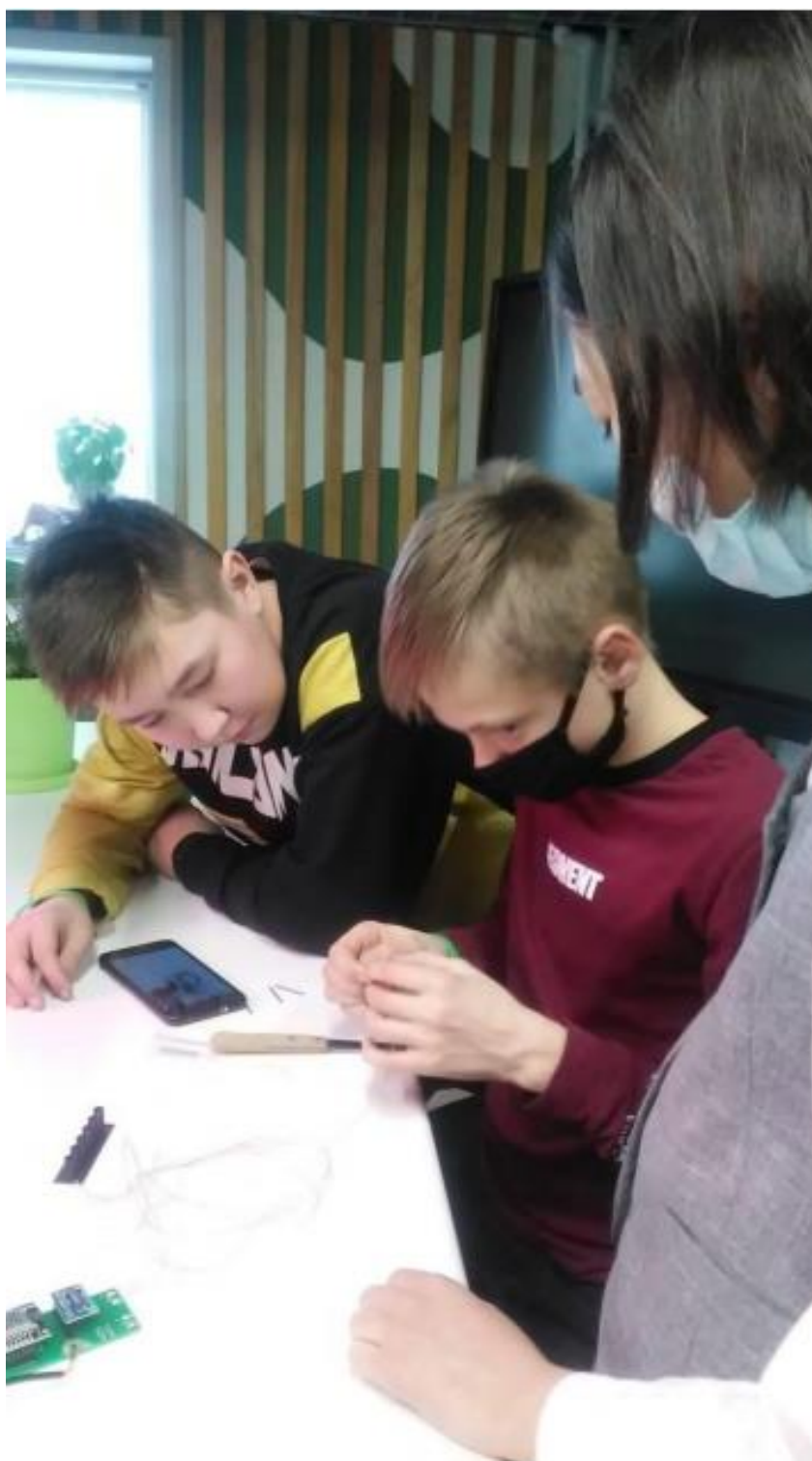
Сборка микробно-топливных элементов.