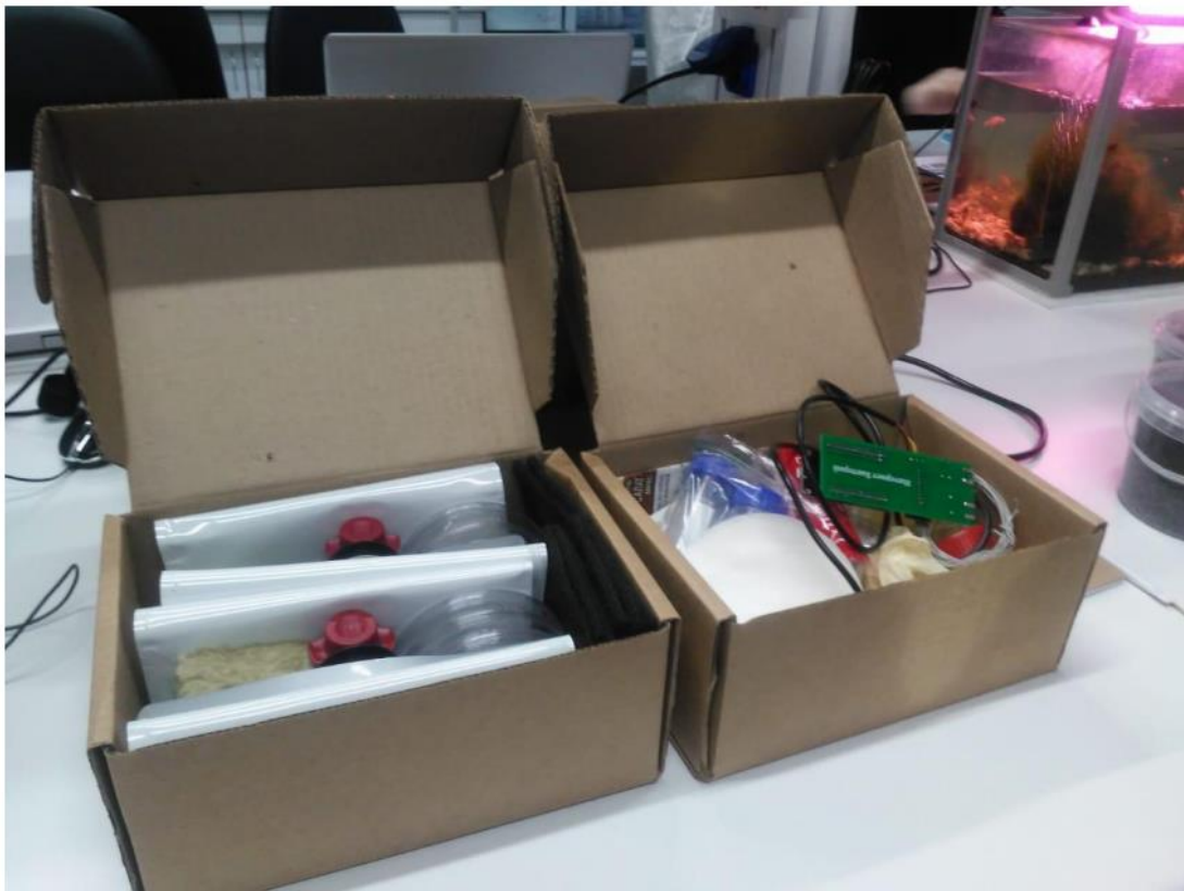
Оборудование для сборки МТЭ