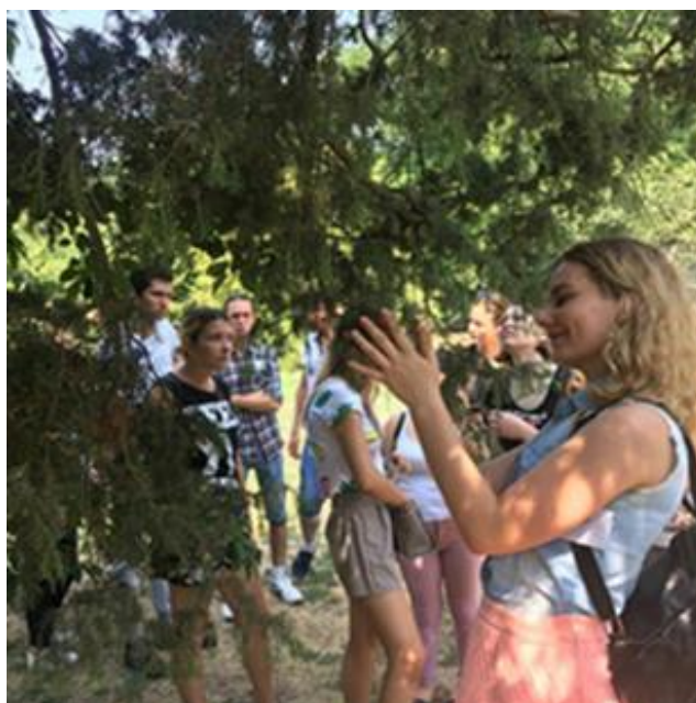
Экскурсия на видовой площадке «Можжевельник колючий»