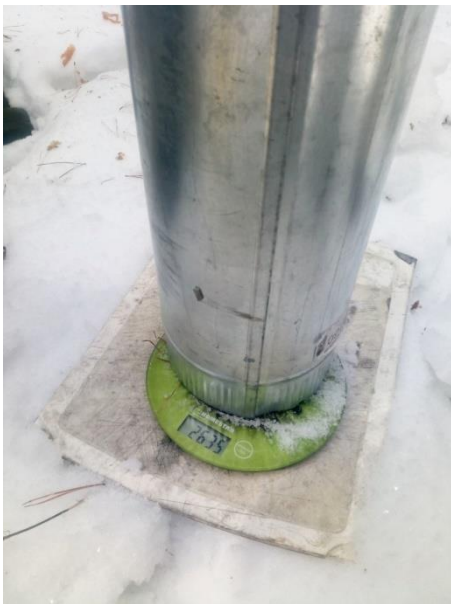
Рис. 6 Взвешивание трубы со снегом