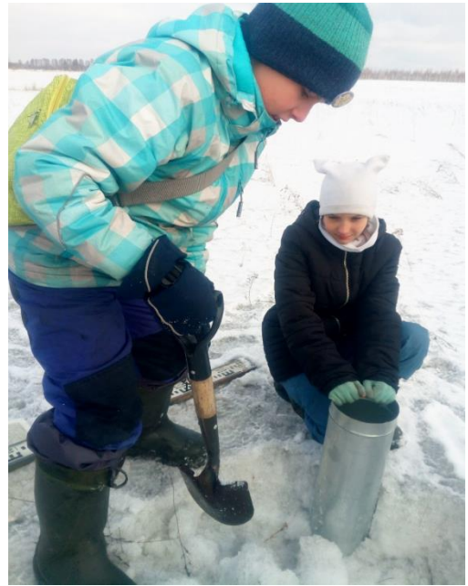
Рис. 5 Вырезание столба снега