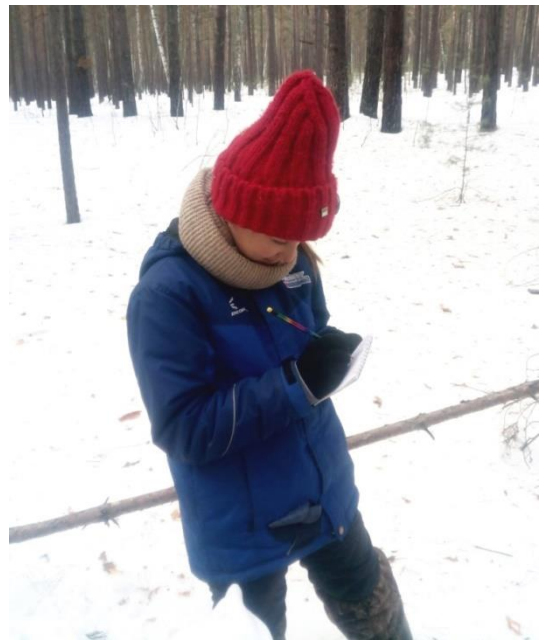
Рис. 7 Запись данных в полевой дневник