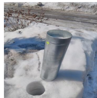
Рис 2. Вырезание снега

В 2022 году забор снега мы производили с помощью трубы диаметром 160мм, высоты которой хватало, чтобы взять пробу снега по всей глубине сугроба.