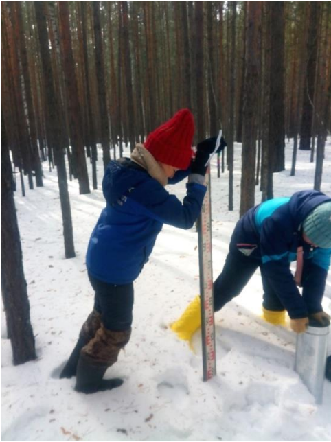
Рис. 4 Измерение высоты снежного покрова