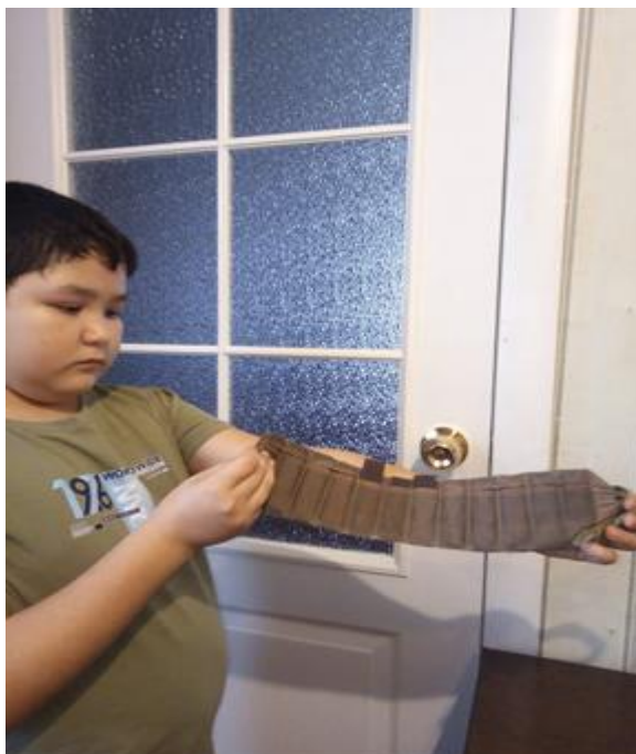
Приложение 1. Пояс от радикулита