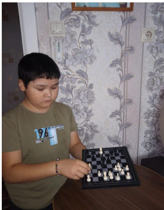
Приложение 2. Магнитные шахматы