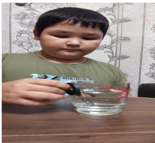
Приложение 8. Магнитная сила