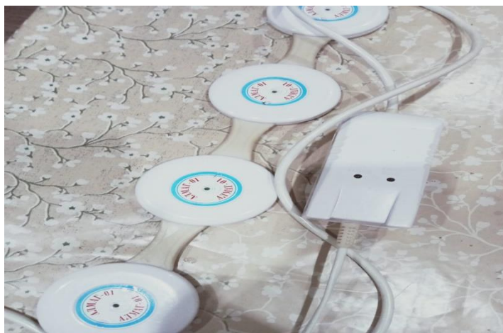
Приложение 6. Алмаг