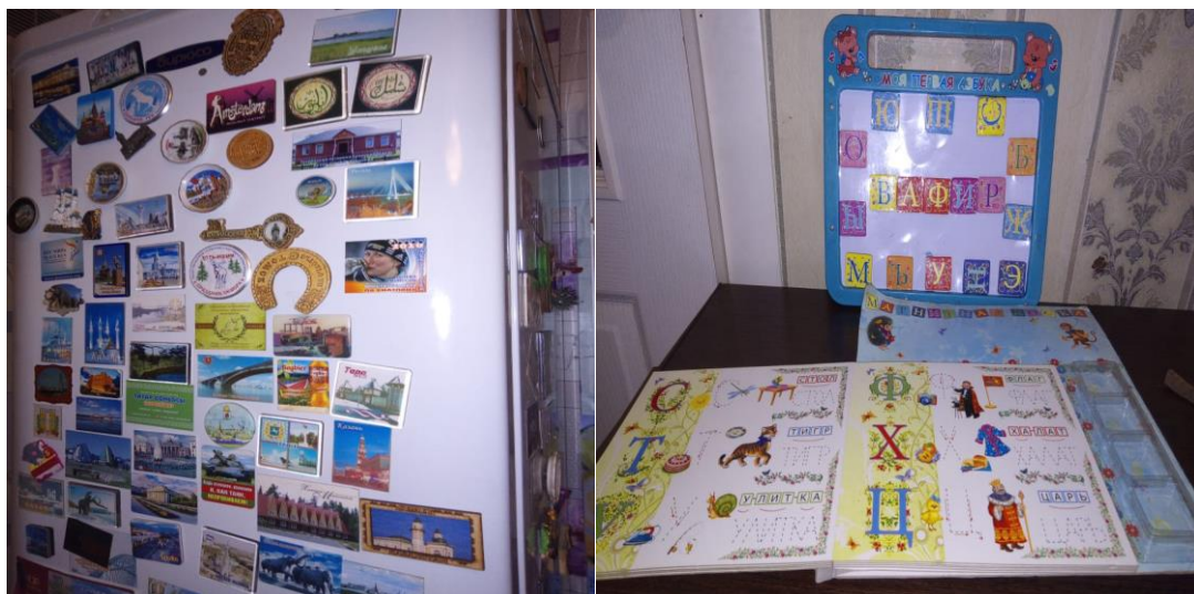
Приложение 5. Магниты на холодильнике