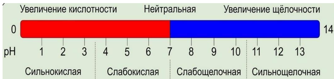
Рисунок 1. Шкала кислотности почвы

Шкала рН имеет значения от 1 до 14, и чем больше цифра, тем меньше ионов водорода содержится в среде. Так, нейтральный грунт имеет значение в интервале 6-7, слабокислый – 5, а слабощелочной – примерно 8. Показатель среды кислой почвы будет примерно 4-5, а щелочной 9-10.