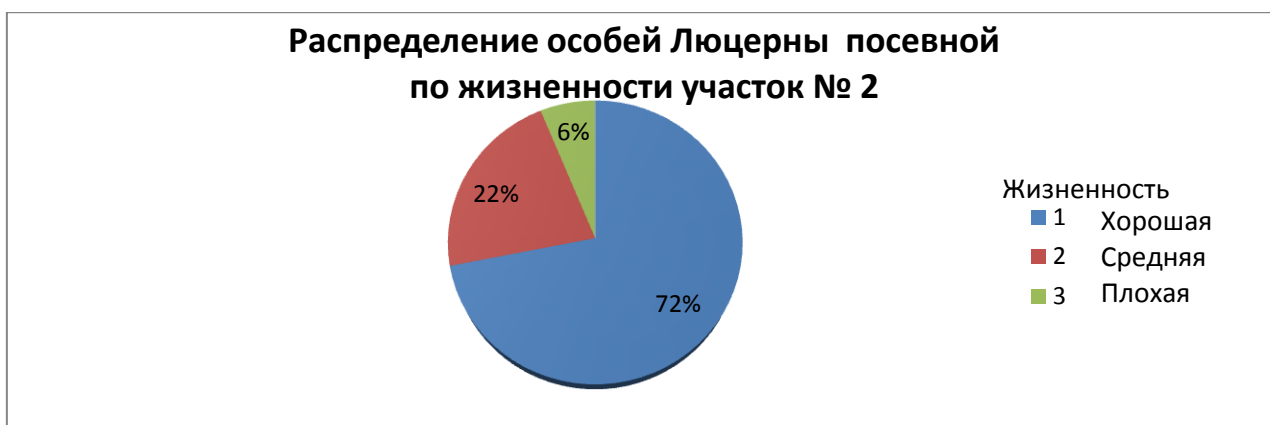
Диаграмма 2. Распределение особей люцерны посевной по жизненности участок № 2

По данной диаграмме мы видим, что жизненность большей части растений на участке №2 - хорошая (72%), 6% растений на исследуемой территории угнетены.