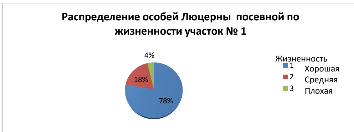
Диаграмма 1. Распределение особей люцерны посевной по жизненности участок № 1

Объектом исследования является популяция люцерны посевной. Наблюдения проводились в июне 2022 года. На участке 100 квадратных метров были взяты 3 участка для наблюдения за жизненностью люцерны площадью по 1 квадратному метру. Показатели участков представлены в диаграммах 1,2 и 3.