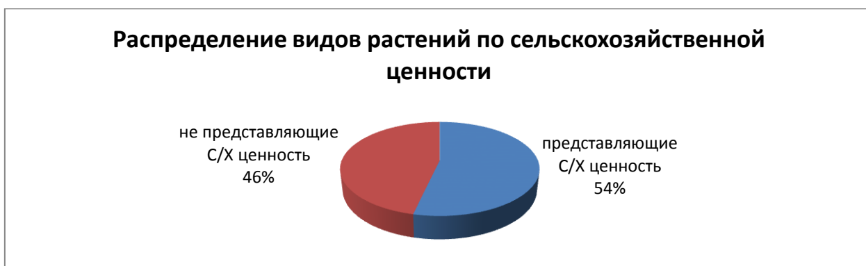
Диаграмма 6. Распределение видов растений по сельскохозяйственной ценности

На исследуемом участке выявлено большое количество сельскохозяйственно-ценных растений. Процент таких растений представлен в Диаграмме 6