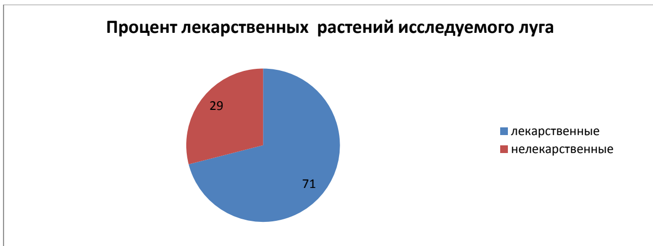
Диаграмма 5. Процент лекарственных растений исследуемого луга

На исследуемой территории были обнаружены лекарственные растения. Полезными свойствами для человека обладают такие растения как: зверобой продырявленный, одуванчик лекарственный, пижма обыкновенная и т. д. Процент видов лекарственных растений от общего числа выявленных на лугу, приведен в Диаграмме 5.