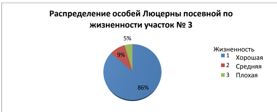
Диаграмма 3. Распределение особей люцерны посевной по жизненности участок № 3

По данной диаграмме мы видим, что жизненность большей части растений на участке №2 - хорошая (72%), 6% растений на исследуемой территории угнетены.