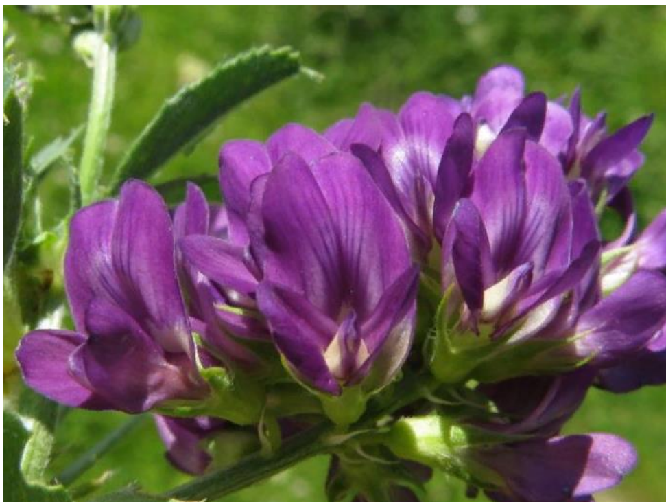
Рис. 1 Люцерна посевная луг около с. Лудяна