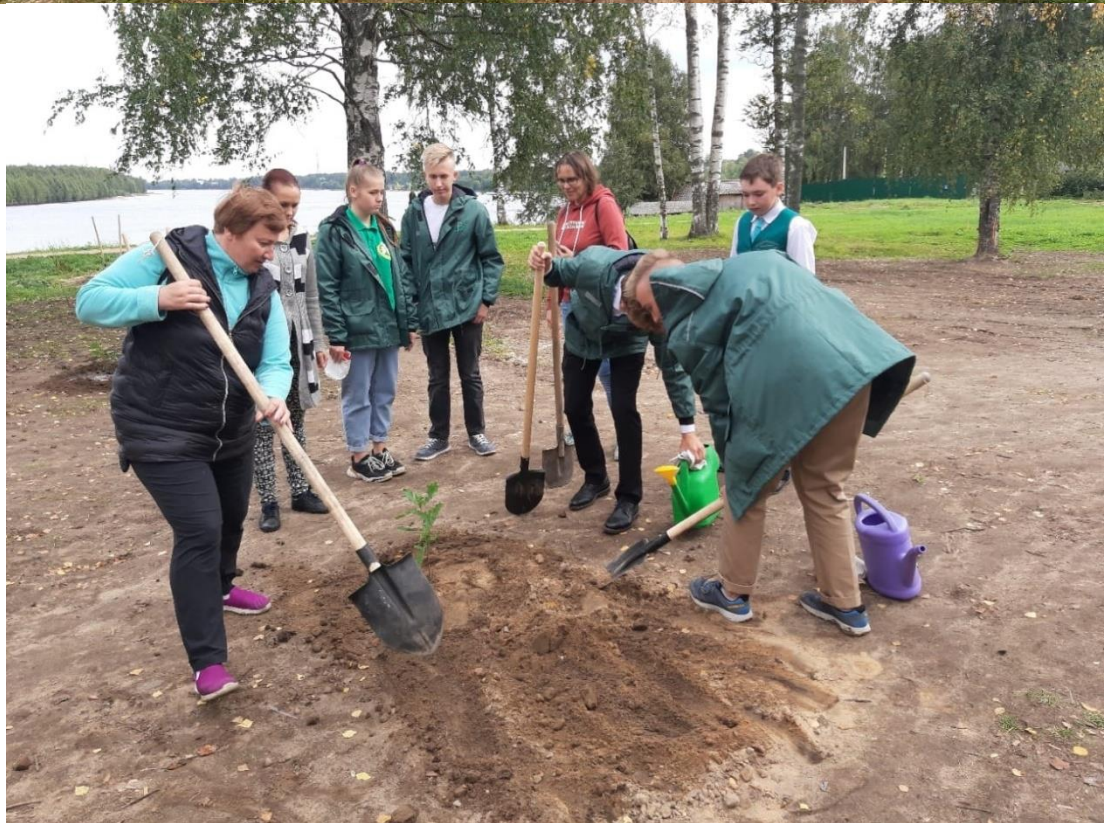
Фото 1. Посадка первых дубов, выращенных из желудей на пустыре, очищенном от мусора.