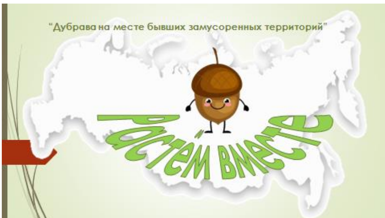
Рис. 1 Эмблема акции "Растем вместе"