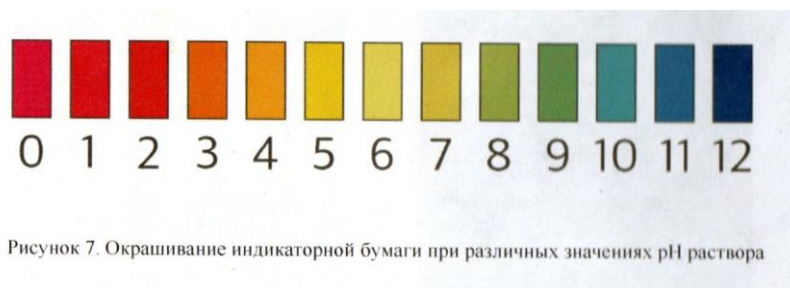
Рисунок 7. Окрашивание индикаторной бумаги при различных значениях pH раствора