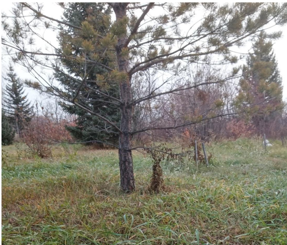
Рис. 1 Внешний вид сосны обыкновенной на участке №1