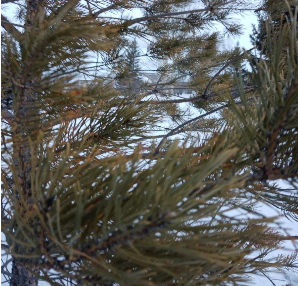
Рис. 3 Внешний вид хвой на площадке №1