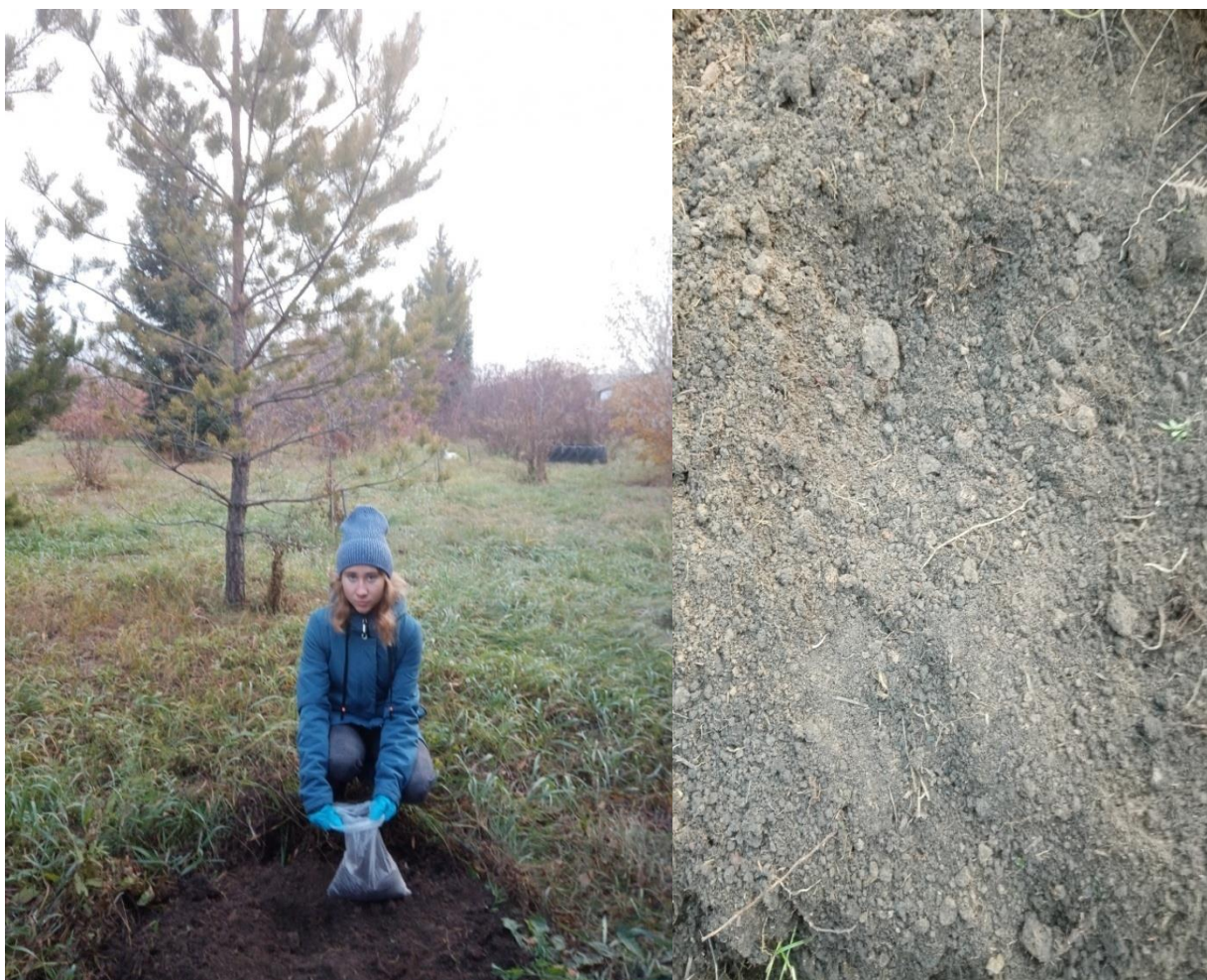
Рис. 1, 2. Участок №1 Сбор почвы, внешний вид почвы