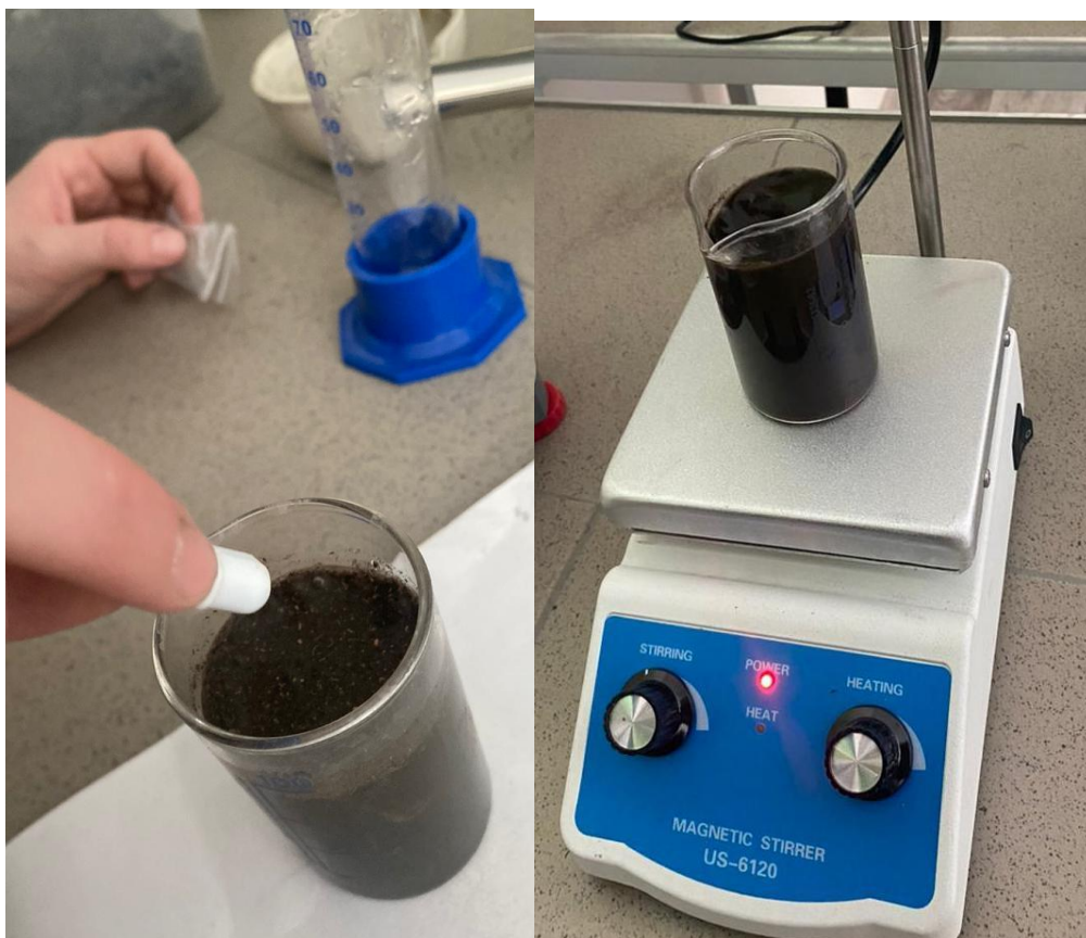
Рис. 1 Добавляем в раствор магнит