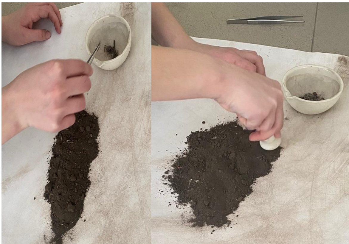
Рис.1, 2 Подготовка почвы