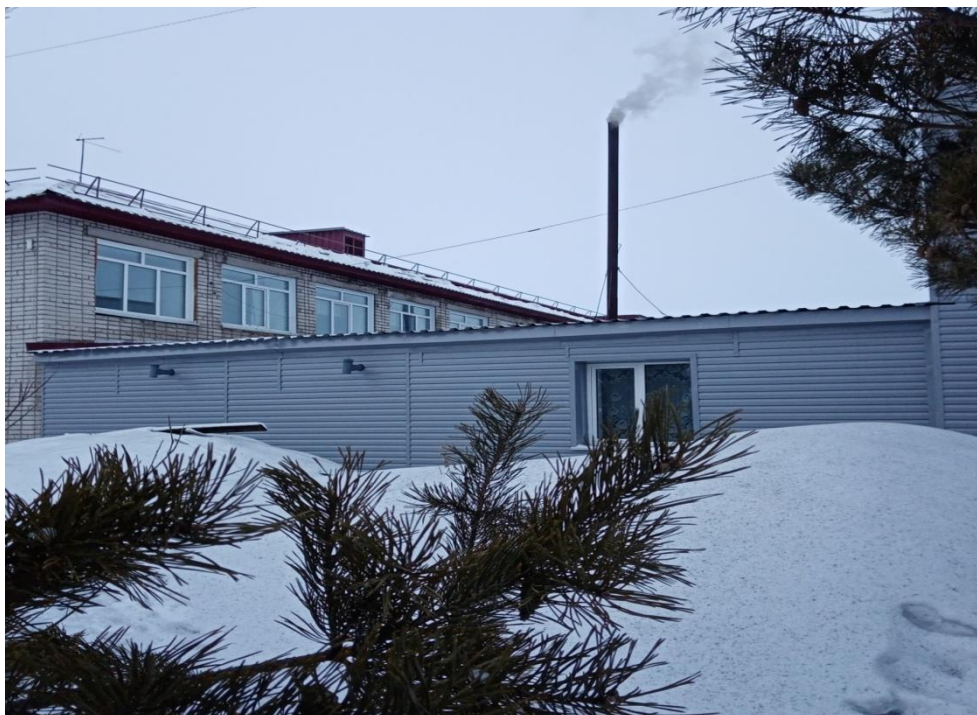
Рис.2 Выбросы школьной котельной окрашивают снег в дендрарии в темно - серый цвет