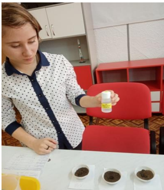
Рис.1 Определение кислотности почв народным способом