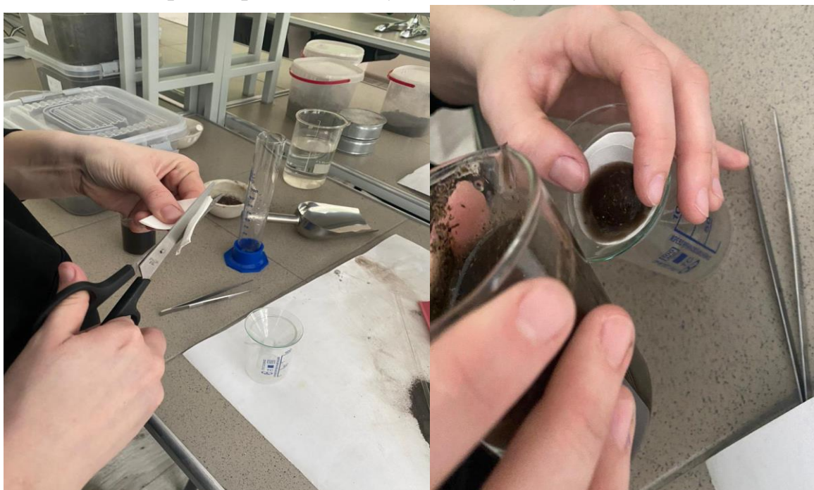
Рис. 2 Ставим раствор на магнитную мешалку