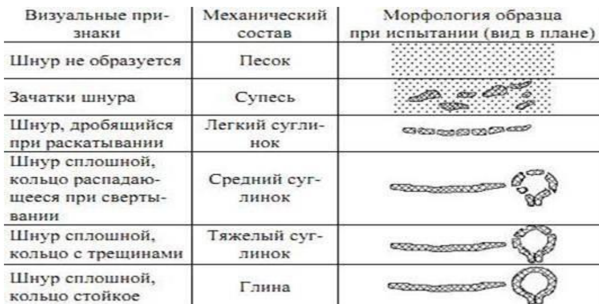
Рисунок 1. Определение гранулометрического состава почв полевым методом раскатывания шнура (А. Ф. Вадюнина, З.А. Корчагина, 1973)

В лабораторных условиях гранулометрический состав определяли мокрым методом: почва увлажняется до состояния густой пасты и хорошо перемешанная и размятая в руках раскатывается в шнур толщиной около 3 мм, а затем свертывается в кольцо. В зависимости от поведения шнура при свертывании в кольцо производится классификация почв по гранулометрическому составу по нижеследующим критериям.[9]