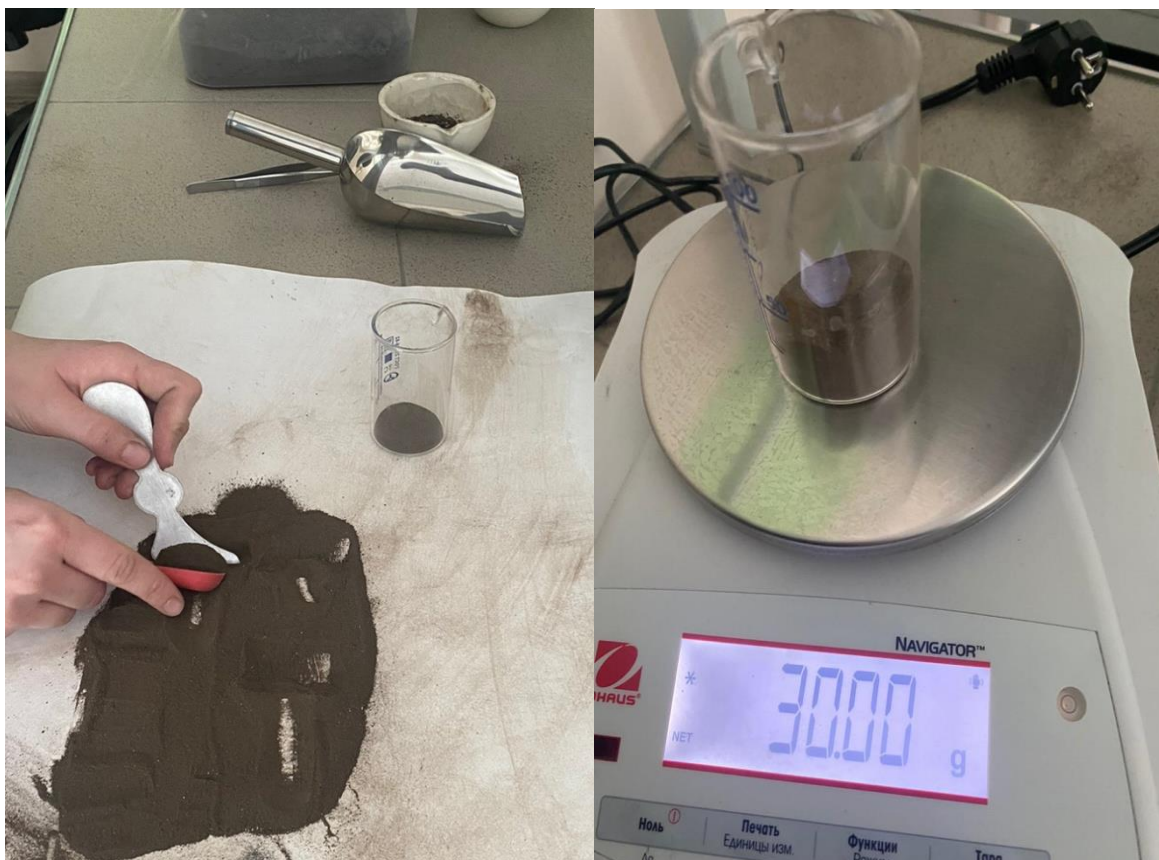
Рис. 1, 2, 3, 4 Приготовление почвенной вытяжки