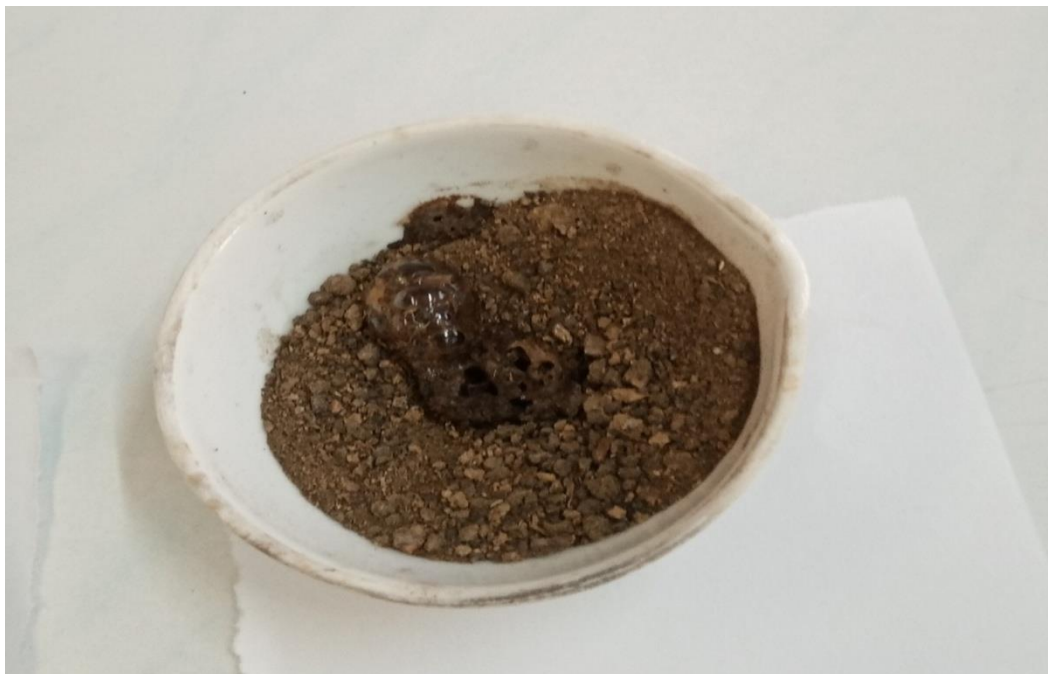
Рис. 2 Образец почвы №1 – сильное пенообразование – почва щелочная