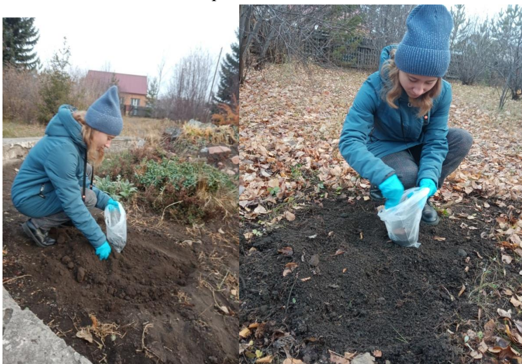
Рис. 3 Участок №2