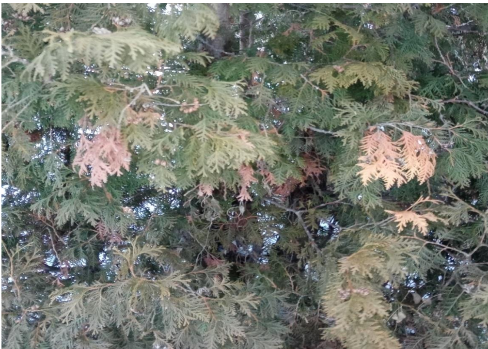
Рис. 4. Внешнее состояние туи западной на площадке №1