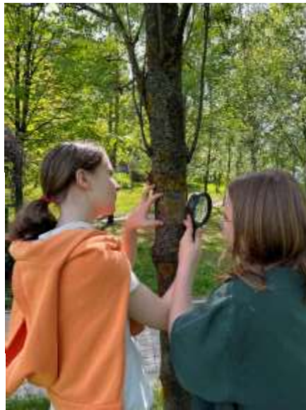
Рисунок 1. Процесс подсчёта обилия лишайников

В качестве индикатора чистоты воздуха использовался индекс полеотолерантности (IP), вычисляемый по формуле: