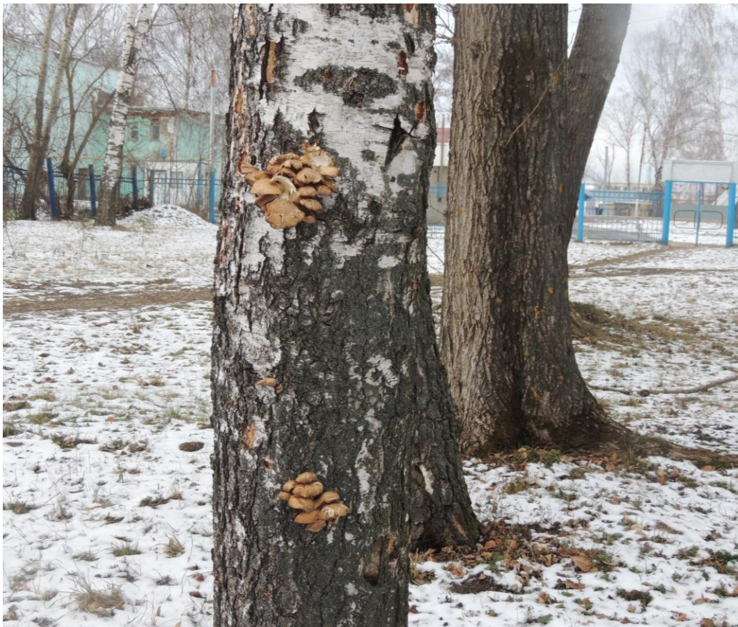
Фотография 6 — Вешенка обыкновенная на березе