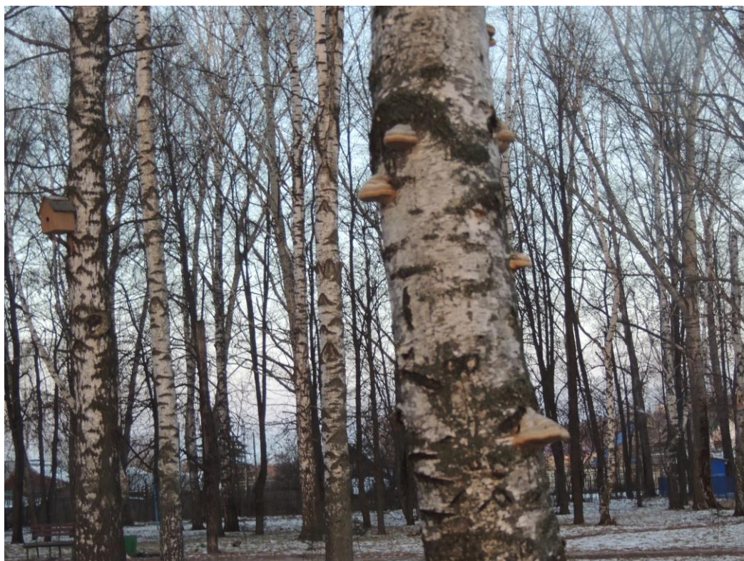
Фотография 3 — Трутовик окаймленный