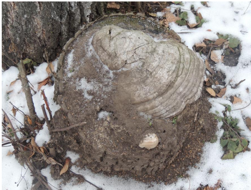
Фотография 2 — Трутовик настоящий

В ходе маршрутного учёта были отмечены в большом количестве Трутовик настоящий, Трутовик окаймленный, Аурикулярия пленчатая, остальные единицами: Трутовик пахучий Трутовик Разноцветный Ложный трутовик Трутовик скошенный , представленные на фотографиях