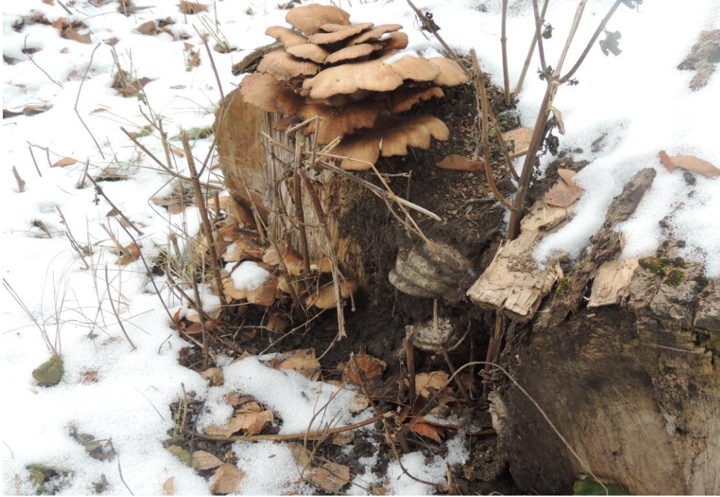
Фотография 5 — Вешенка обыкновенная на пне