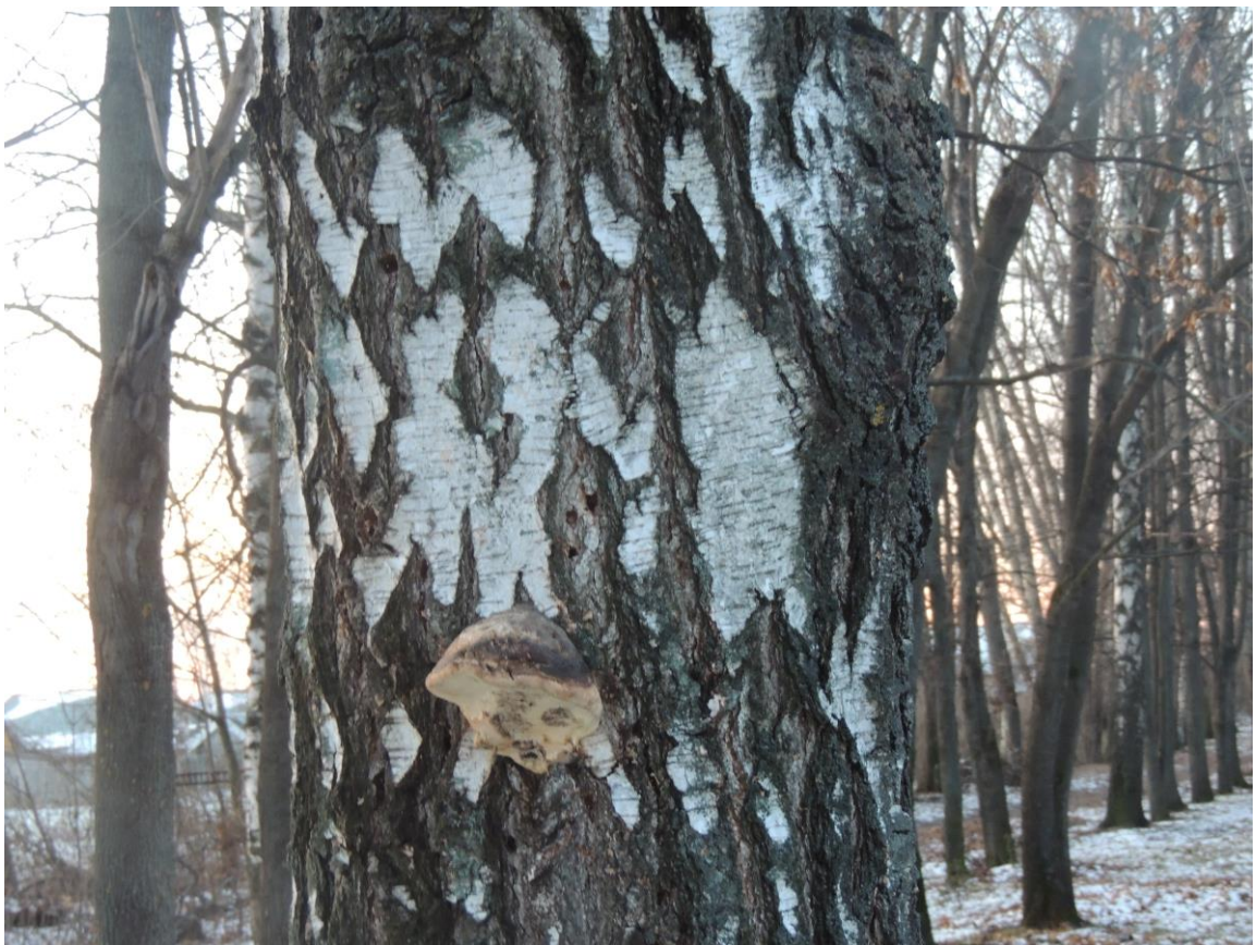
Фотография 4 — Ложный трутовик