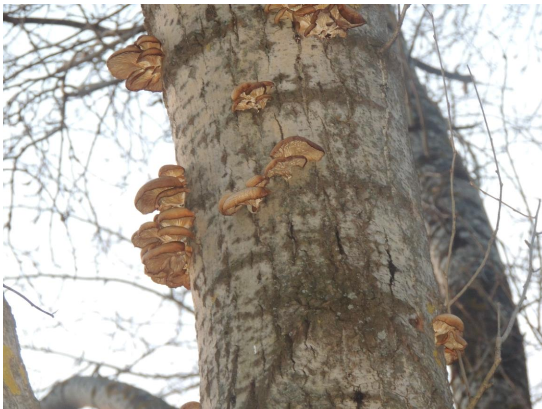
Фотография — Вешенка обыкновенная на тополе.

Большинство древесных грибов были найдены на мёртвой древесине, на пеньках за исключением трутовика чешуйчатого, ложного трутовика и вешенки обыкновенной, которые были найдены на живых деревьях, так как на живых деревьях способны развиваться сравнительно немногие виды трутовых грибов, что объясняется их потребностью в витаминах, вырабатываемых в процессе жизнедеятельности дерева. Большая же часть грибов поражает мёртвую древесину. Узкая специализация по породам-хозяевам редко встречается у древесных грибов. Чаще всего они приурочены к лиственным породам: береза, осина.