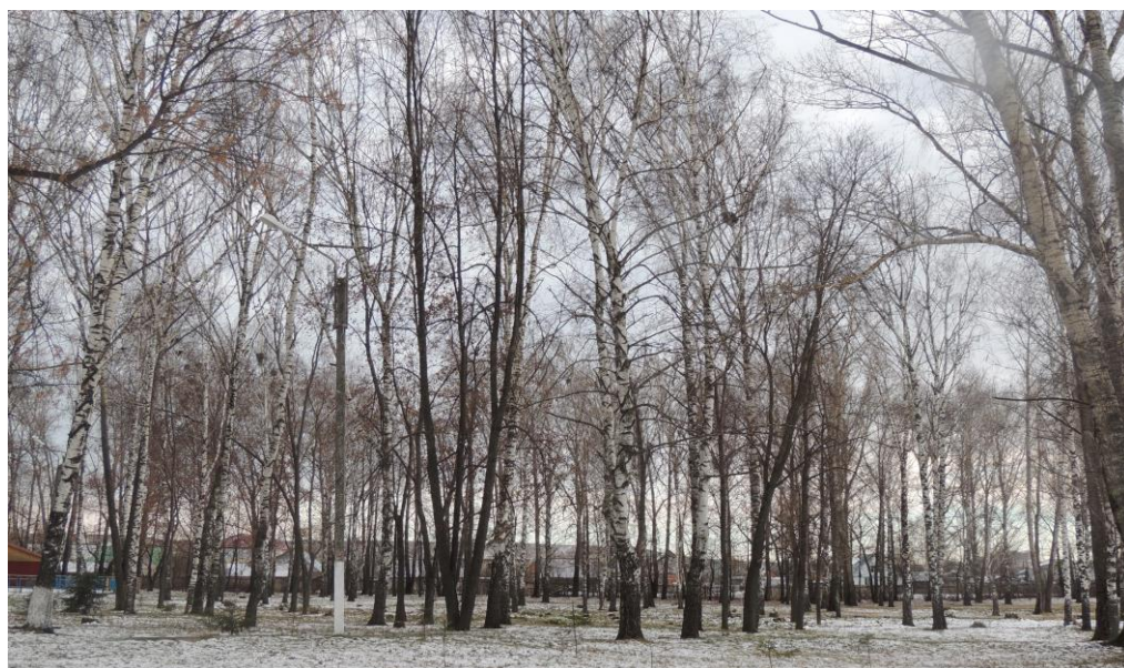
Фотография 1 — Парковая зона села Старое Шайгово

Для того, что бы описание было максимально верным, данные не искаженными – мы провели описание не на границе биотопа, т.е. сначала площадку проходили по её периметру, отмечая все встреченные экземпляры поврежденных и неповрежденных деревьев, а также упавшие и пни. А затем проходили по диагоналям и зигзагом. Осматривались все деревья (как стоячие, так и поваленные) на данной территории. Наша задача – оценить соотношение древесных пород в паркообразующем ярусе. За 100% мы принимаем цифру 10. Соответственно, если на описываемом участке 10 берез, 10 тополей, 6 лип, 4 клена, то они будут соотноситься друг с другом примерно как 5:5:3:2. Теперь можно записать так называемую формулу состава древесной стоя (ФСД): 5Б5Т3Л2К. Исходя, из ФСД можно назвать и тип парка: название строится с указанием всех паркообразующих пород, расставляемых по степени увеличения числа стволов в ярусе, т.е. в нашем случае – березово-тополюно – липово - кленовый парк, как представлено на фотографии 1.