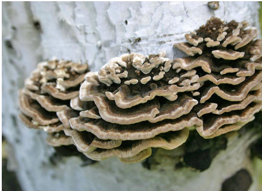
Фотография 3 — Аурикулярия пленчатая