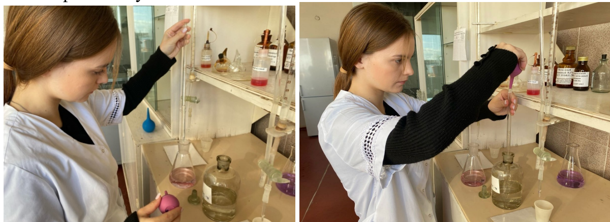
Рис. 2.5.-2.6. Определении массовой концентрации кальция Массовую концентрацию кальция X, мг/дм 3 , вычисляют по формуле:

Объем исследуемого раствора помещают в коническую колбу, добавляют 90-100 см 3 дистиллированной воды, 2 мл раствора гидроксида натрия, 0,2-0,3 г мурексида и титруют раствором трилона Б до перехода окраски из розово-красной в фиолетовую.