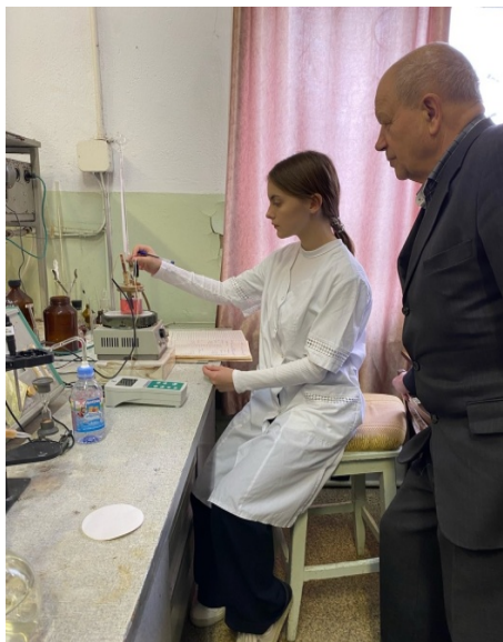
Рис. 2.8. Определение брома

8. Определение брома. При проведении анализа использовали иономер-потенциометр пХ-150-МИ. Навеску соли измельчили, растворили в воде. Раствор соли отобрали на анализ. Проведение анализа заключалось в титровании раствора соли азотнокислым серебром в кислой среде с добавлением индикатора