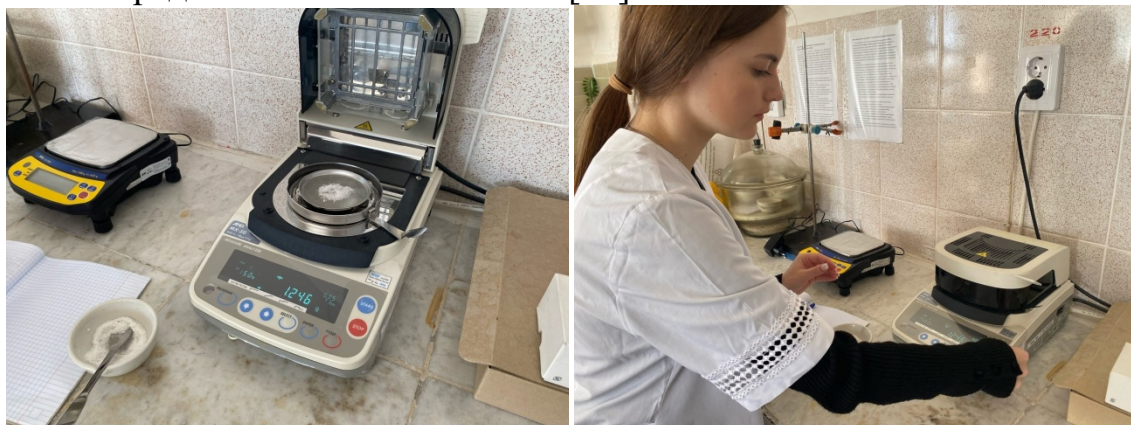
Рис 2.1.-2.2. Определение влажности соли