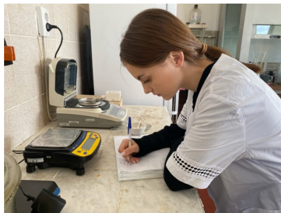
Рис. 2.9.-2.10. Обработка результатов.

Все лабораторные работы проведены нами в химико - аналитической лаборатории ГУ НПП РК «Крымская ГГРЭС» согласно типовых методик.