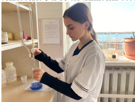
Рис. 2.7. Определение магния

При проведении анализа использовали: колбы конические вместимостью 250 см 3 . Колбы мерные вместимостью 100, 250 см 3 . Пипетки с делениями вместимостью 5 и 10 см 3 . Пипетки без делений вместимостью 25 см 3 .