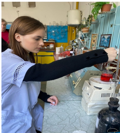
Рис. 2.8. Определение хлора

Массовую концентрацию хлоридов, мг/дм 3 , вычисляют по формуле