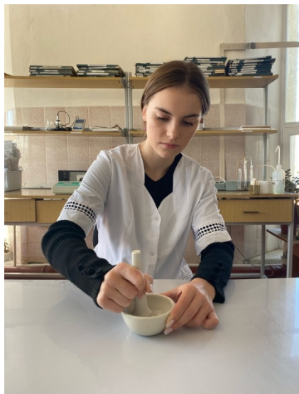
Рис 2.4. Определение кальция

Сущность метода: кальций титруют в щелочной среде (рН 12) раствором трилона Б с индикатором мурексидом.