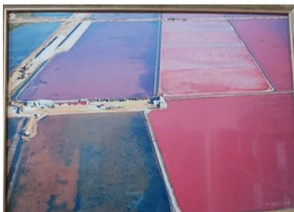
Рис. 1. Акватория озера Сасык-Сиваш

Метод производства соли поваренной зерновой и соли морской на Сасык-Сивашском солепромысле основан на последовательном испарении морской воды на акватории озера Сасык-Сиваш и в системе подготовительных и солесадочных бассейнов (см. рис.1).