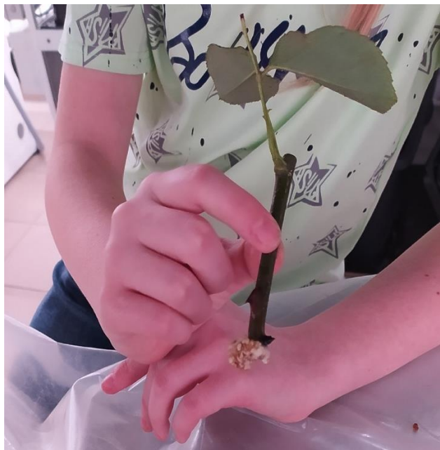
Образование каллюса и корней у розы флорибунда