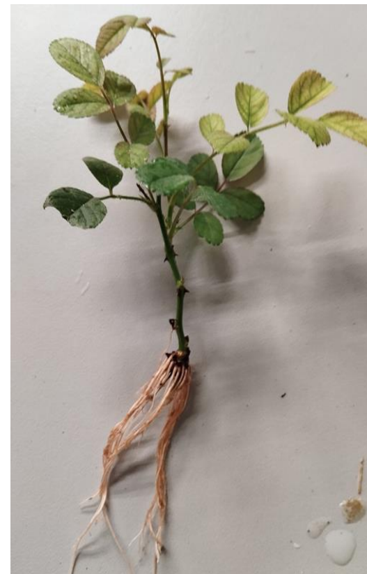
Развитие корне у почвопокровной розы