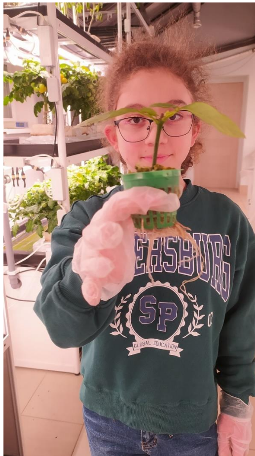
Образование корней у плетистой розы