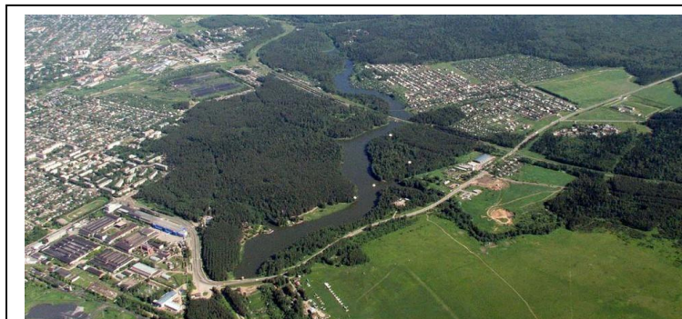
Парк "Харинка" и реки Харинка

В части парка, находящейся ближе к заводу чесальных машин, были возведены аттракционы и другие парковые сооружения. Около парка с разных сторон расположены школа №41, автозаправочная станция, спортивный аэродром Ясюниха на котором проходят тренировочные полёты спортивных самолётов, а также осуществляются прыжки с парашютом.