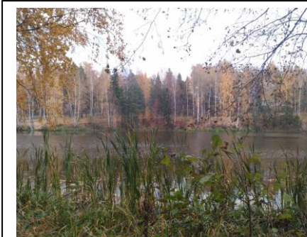
Парк Харинка, Иваново, ул. Павла Большевикова

Актуальность темы заключается в том, что благоустройство и озеленение является важнейшей сферой деятельности человека.