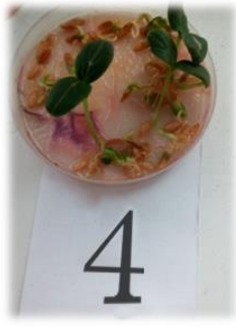
Фото 7. Всходы в воде