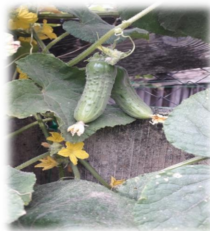
Фото 15-16. Первые плоды