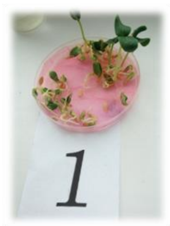
Фото 4. Всходы в растворе алоэ