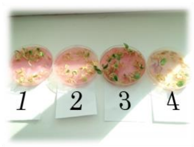
Фото 3. Прорастание семян.