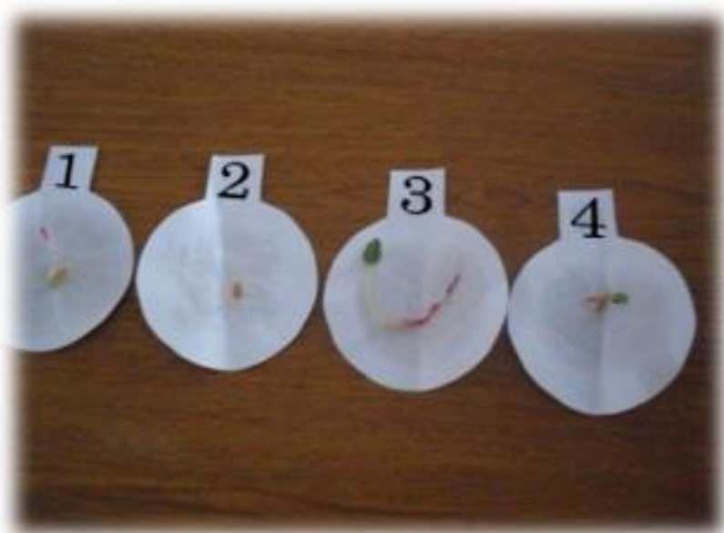
Фото 8. Биометрические измерения