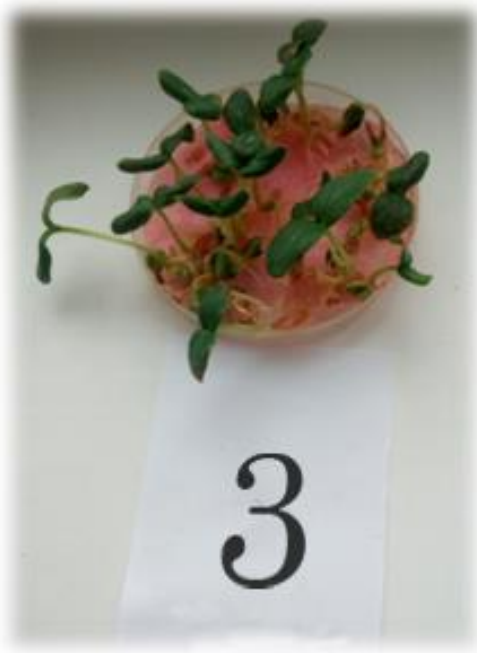
Фото 6. Всходы в растворе дрожжей