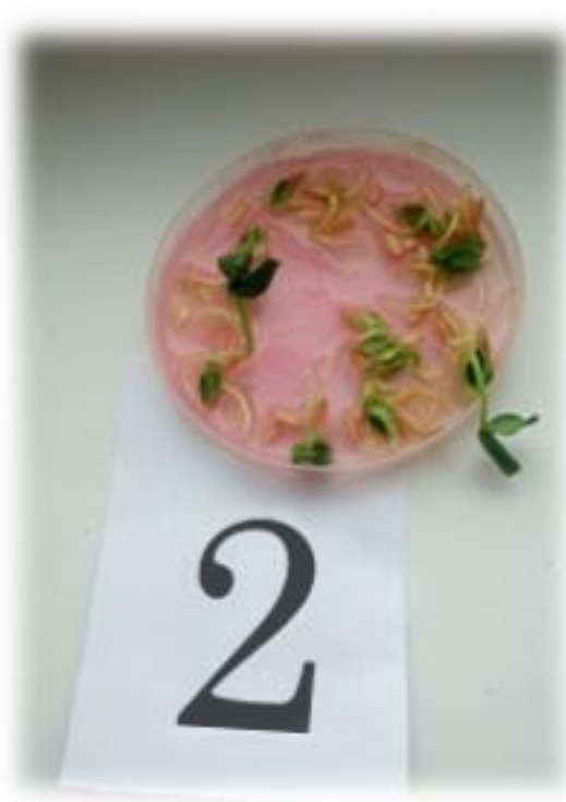
Фото 5. Всходы в растворе мёда