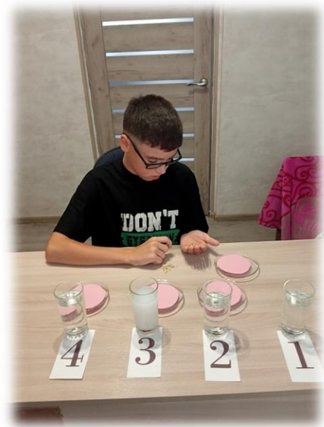
Фото1-2. Подготовка семян к замачиванию.