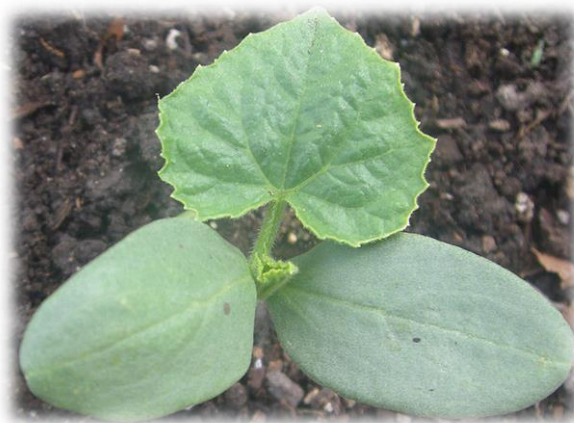
Фото 10. Появление первого настоящего листа