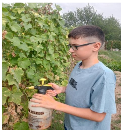
Фото 19. Опрыскивание растений раствором дрожжей