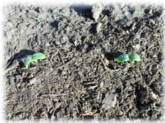
Фото 9. Первые всходы