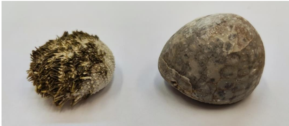
Приложение 9. Древний морской еж и современный (высушенный)