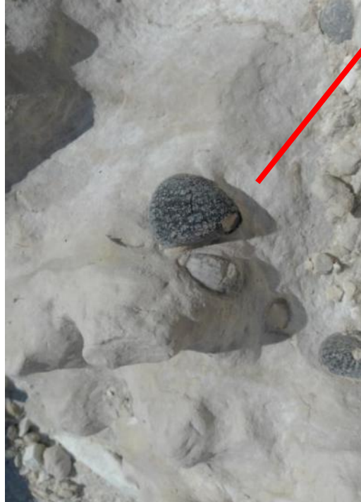
Приложение 6. Окаменелость морского ежа в породе Фото из семейного архива Багровых, июль 2024 года