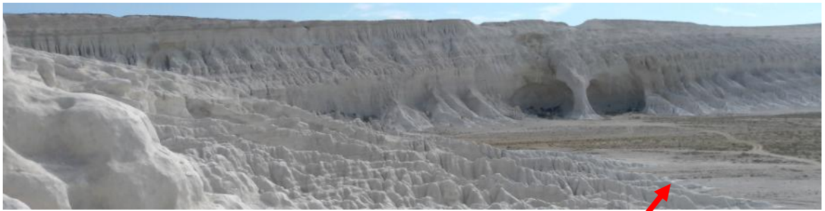
Меловые известняки солончака Тузбаир