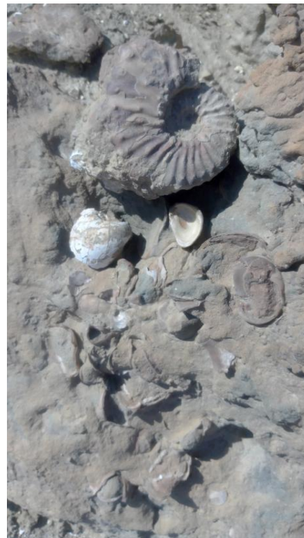
Приложение 5. Окаменелости, найденные в окрестностях солончака Тузбаир Фото из семейного архива Багровых, июль 2024 года