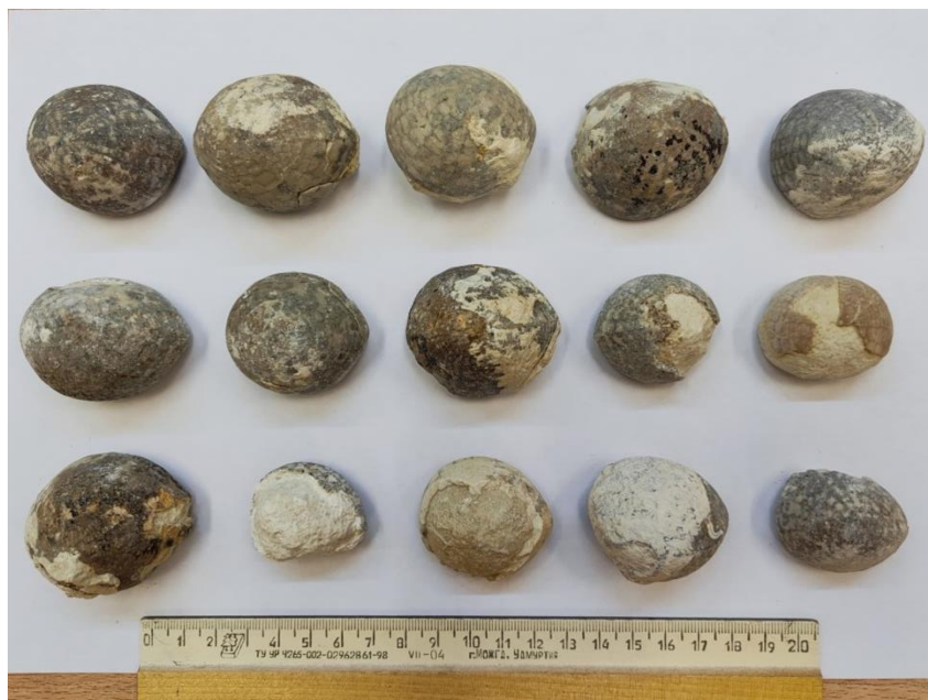
Приложение 7. Образцы ископаемых морских ежей. Фото автора, 2024 год