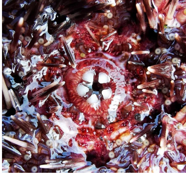
Приложение 4. Ротовое отверстие морского ежа, Аристотелев фонарь