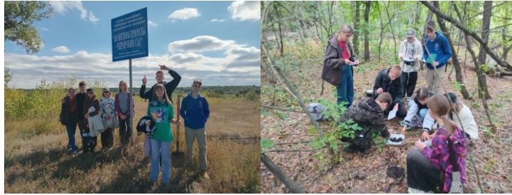
Работа в полевых условиях в составе команды