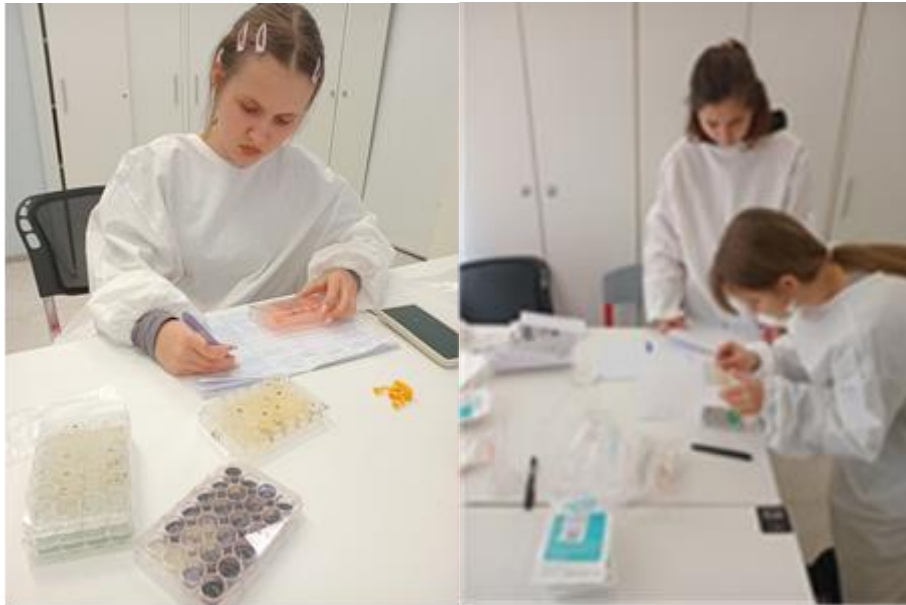
Работа в лаборатории по теме исследования