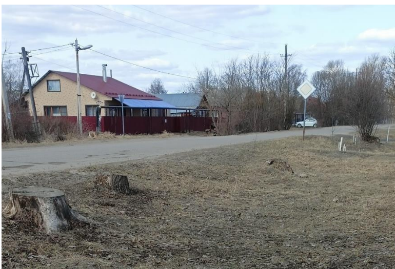
Рисунок 2. Улица Энгельса. Разделительная полоса автодороги и тротуара Как выглядит эта разделительная полоса на главной автодороге города?

Озеленение автомобильных дорог в городской среде предназначено для защиты населения от вредного воздействия отработанных газов автомобильного транспорта. Растения обладают свойством поглощать газообразные отходы. На автодорогах общегородского пользования предусмотрена разделительная полоса шириной до 6 метров, которая подлежит озеленению. Эта разделительная полоса с насаждениями отделяет тротуар от проезжей части и служит защитой пешеходов от неблагоприятного воздействия выхлопных газов и пыли.