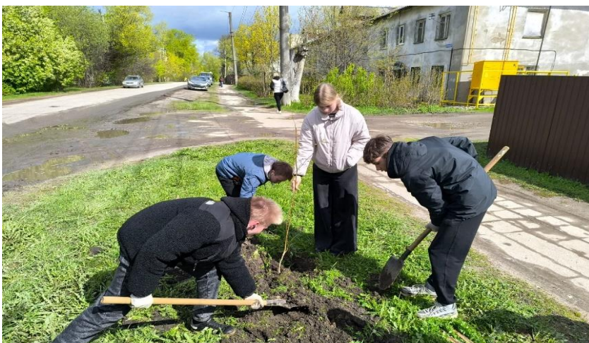
Рисунок 3. Посадка лип в городе

Большая часть автомобильной дороги, которая ведет к нашей школе не имеет обустроенного газона. Между тротуаром и дорогой есть разделительная полоса, но она активно используется автомобилями для парковки. Что можно сделать? Нашли вот такой выход. Эта работа была представлена на родительском собрании (см. рис. 4). Наши родители составили обращение в Совет депутатов Наволокского городского поселения с просьбой «рассмотреть возможность обустройства газона между проезжей частью и тротуаром». Появилась надежда, что наша городская среда станет комфортнее.