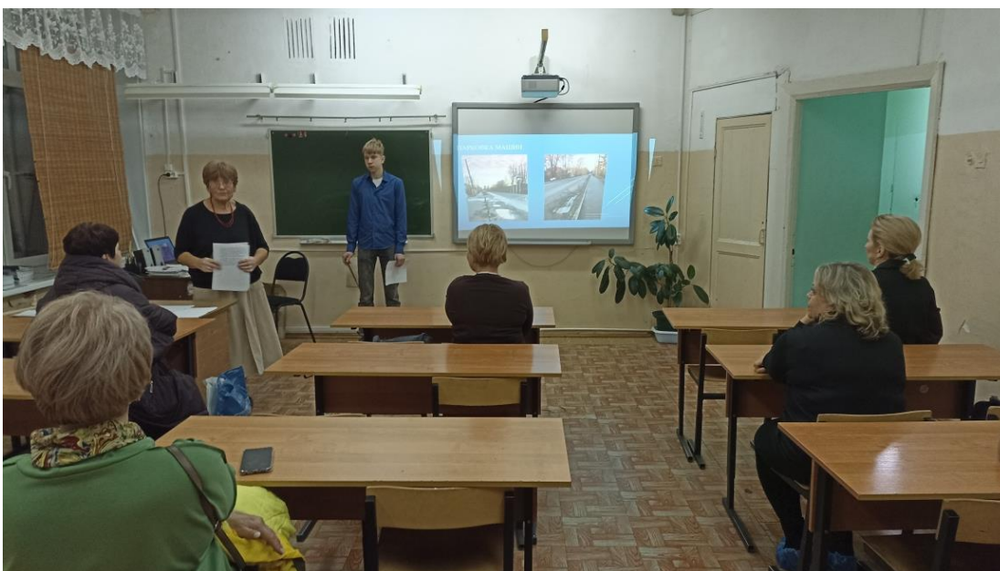
Рисунок 4. Защита работы на родительском собрании

Большая часть автомобильной дороги, которая ведет к нашей школе не имеет обустроенного газона. Между тротуаром и дорогой есть разделительная полоса, но она активно используется автомобилями для парковки. Что можно сделать? Нашли вот такой выход. Эта работа была представлена на родительском собрании (см. рис. 4). Наши родители составили обращение в Совет депутатов Наволокского городского поселения с просьбой «рассмотреть возможность обустройства газона между проезжей частью и тротуаром». Появилась надежда, что наша городская среда станет комфортнее.