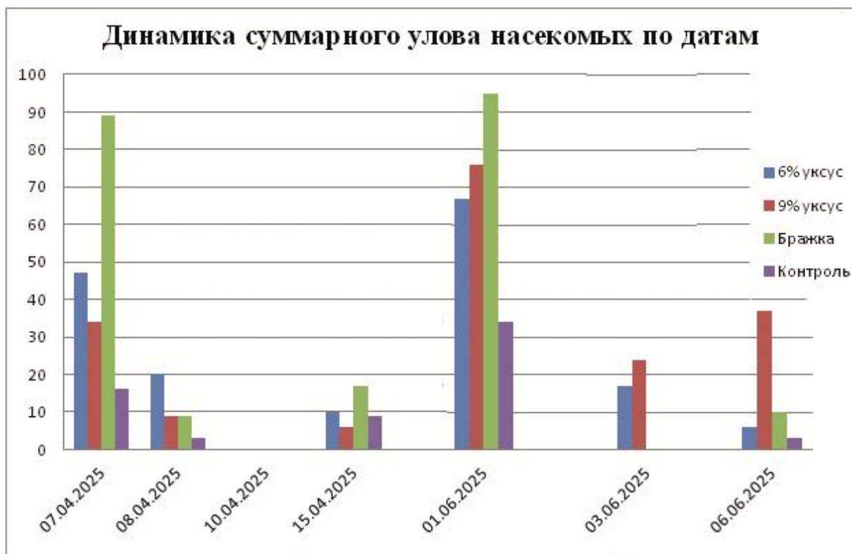
Диаграмма 2. Динамика суммарного улова насекомых по датам