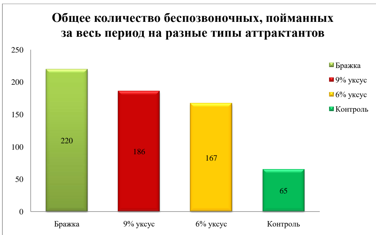
Диаграмма 1. Сравнительная эффективность приманок

Уксусные приманки также показали хорошие результаты, причём 9% уксус был немного эффективнее 6% (186 и 167 особей соответственно). Это может быть связано с более интенсивным запахом. Контрольная группа закономерно показала наименьший результат (65 особей), что демонстрирует важность использования аттрактантов для мониторинга.