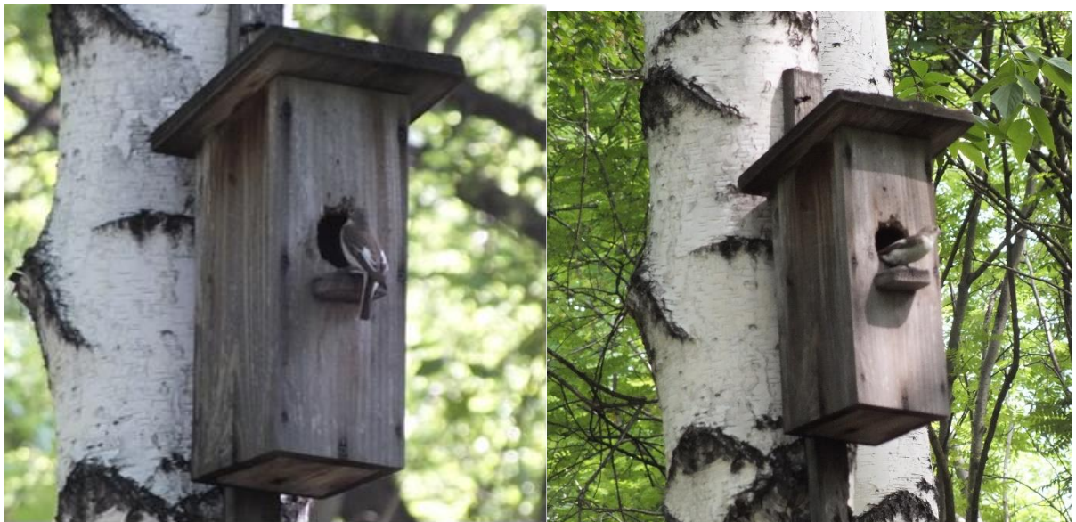
Фото.7. ИГ №53, мухоловка-пеструшка, 2024 г., 2025 г.