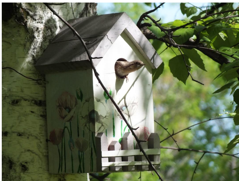
Фото.4. Вертишейка, ИГ №63, 2025 г.