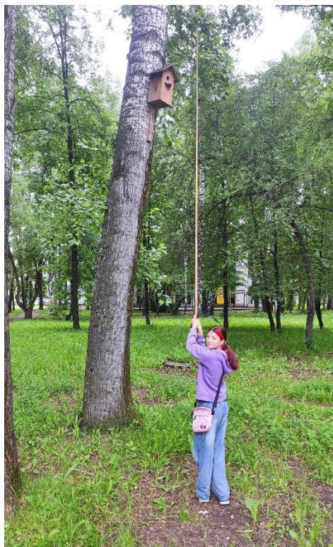
Фото.1. Использование видеозндоскопа для наблюдений за ИГ.