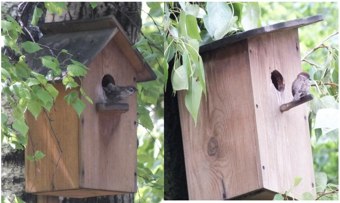
Фото.6. Полевые воробьи, ИГ №35, №38. 2024 г.