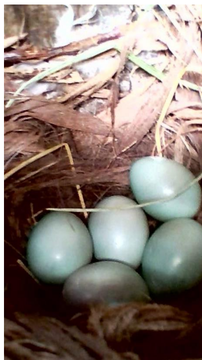
Фото.2. Фотография гнезда с помощью видеозндоскопа в ИГ №3.