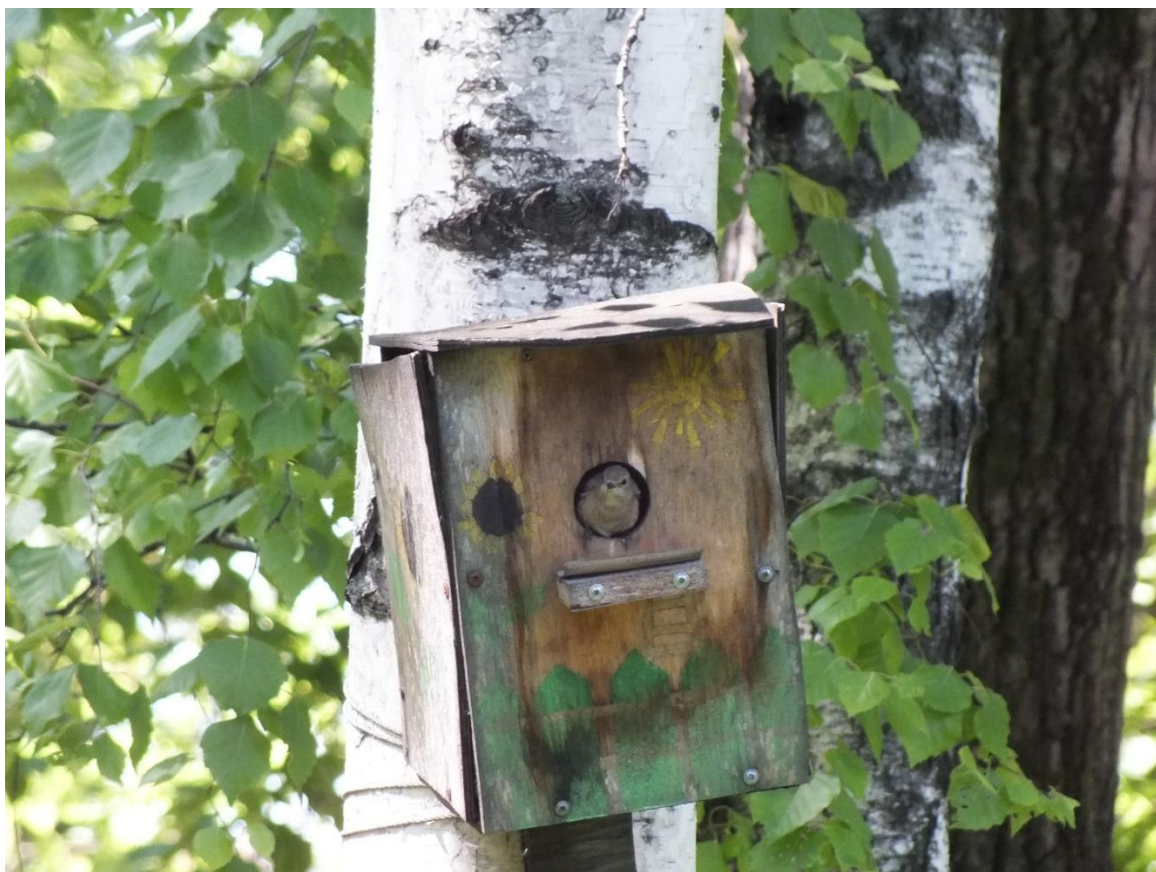
Фото.3. ИГ №49А в парке им.Гагарина.