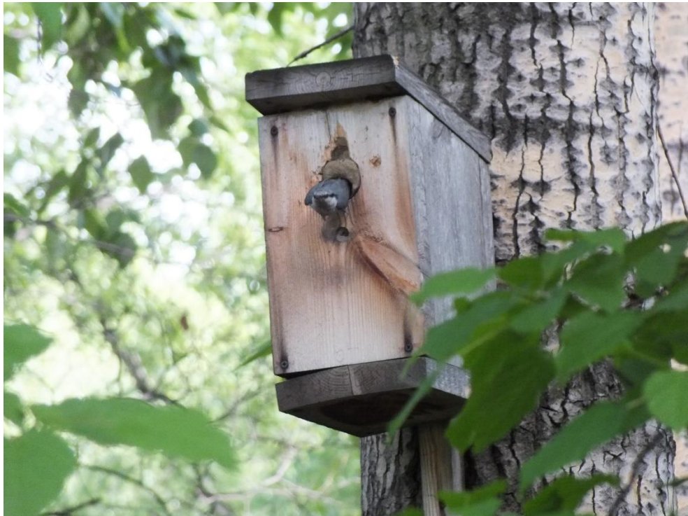
Фото.5. Поползень обыкновенный, ИГ № 77, 2025 г.