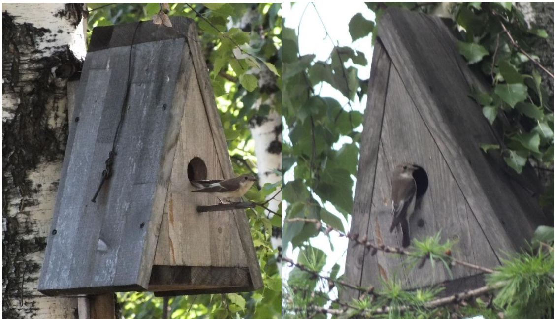
Фото.8. ИГ№11, мухоловка-пеструшка, 2018 г., 2024 г..