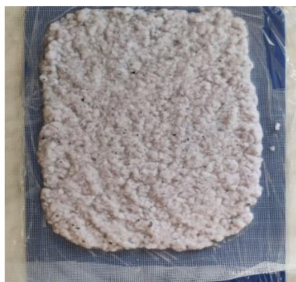
Фото 4. Формирование вида, подобного листу бумаги

Далее бумажную массу необходимо выложить на заранее подготовленную сетку. Это нужно сделать для того, чтобы вышли излишки воды. А для того, чтобы форма листа была ровной, под сетку можно подложить что-то плоское и твердое.