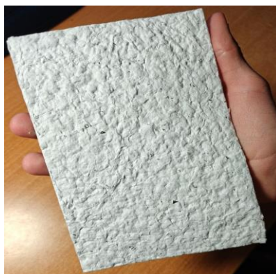
Фото 8. Финальный результат

Вывод: переработка макулатуры – эффективный способ утилизации бумажных отходов, сокращающий использование первичного сырья и сохраняющий лесные ресурсы. Это важный инструмент для устойчивого развития и снижения негативного воздействия бумажной промышленности на окружающую среду.