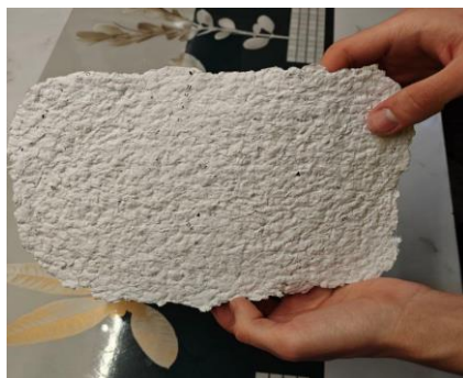
Фото 7. Готовый лист бумаги

Спустя некоторое время, лист стал полностью готовым к повторному использованию (фото 7).