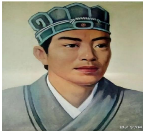
Рис.1 Цай Лунь

Изначально бумажные изделия были дороги и предназначались исключительно для письма. Но со временем производство бумаги стало более массовым и распространилось по всему миру. В Европу бумага проникла через Испанию, Византию и Италию в период с IX по XI века. К XI веку бумага уже активно использовалась в Арабском мире и Индии, постепенно вытесняя папирус и пергамент с рынка.