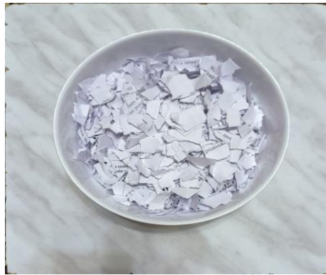
Фото 1. Первичная заготовка

В качестве исходного сырья для переработки была использована макулатура, образовавшаяся в процессе обучения. Первичная переработка бумаги предполагает измельчение на кусочки размером 1–5 см, что позволяет ускорить процесс переработки отходов (фото 1):