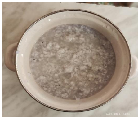
Фото 3. Бумажная масса

После того как бумага разбухнет, ее с помощью погружного блендера нужно измельчит до максимально однородной массы. При правильном выполнении на этом этапе переработки должна получиться своего рода бумажная каша. (фото 3). Необходимо чтобы кусочки бумаги были максимально мелкие. Таким образом, если исходная бумага имела цветные участки, в готовом продукте они не проявятся сильно.