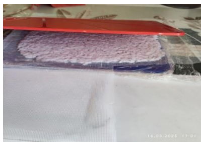
Фото 5. Выравнивание листа

После всех вышеперечисленных манипуляций относительно формы бумаги остается только ждать до полного высыхания листа, так как на данном этапе такая бумага является непригодной к использованию (фото 6).