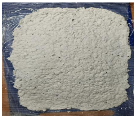
Фото 6. Лист на стадии высыхания

После всех вышеперечисленных манипуляций относительно формы бумаги остается только ждать до полного высыхания листа, так как на данном этапе такая бумага является непригодной к использованию (фото 6).