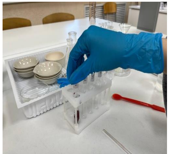
Фото 3 и 4. Промывание пластинок в воде и помещение их в пробирки.

В первую пробирку я налила дистиллированную воду; во вторую – 1М раствор сахарозы; в третью – 2М раствор сахарозы; в четвертую – 12% раствор глицерина; и в пятую – 12% раствор глицерина и 2М раствор сахарозы в соотношении 1:1. Все пробирки я пронумеровала. Количество пластинок свеклы и объём жидкости во всех пробирках одинаковые.