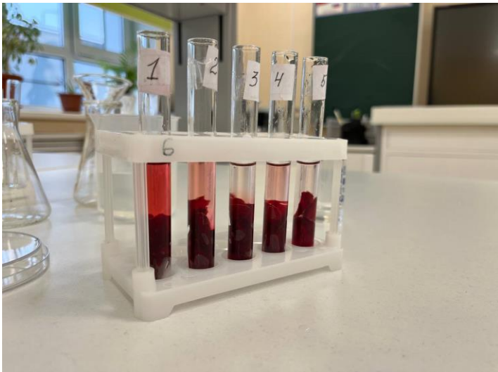
Фото 11. Третий опыт

Результаты третьего опыта показали, что окрашивание в пробирках №1 (самое сильное) и №4 (самое слабое) подтвердились. А вот раствор в пробирке №4 (12% раствор глицерина) оказался чуть более розовым, чем в пробирке №3 (2М раствор сахарозы).