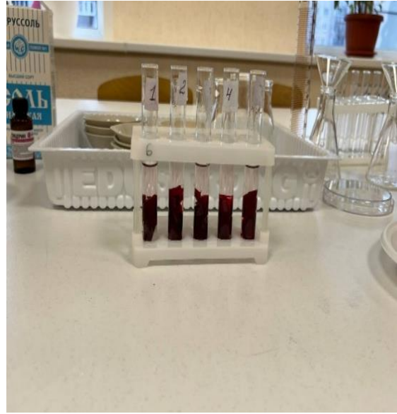
Фото 5 и 6. Подготовка пробирок к замораживанию.

Пробирки поместила в охлаждающую смесь: 3 части снега и 1 часть соли. Через 30 – 40 минут пробирки замёрзли.