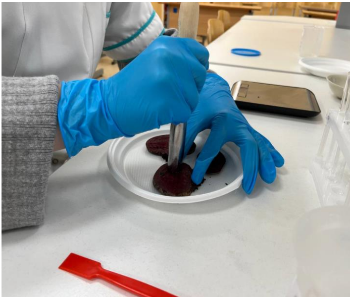
Фото 2. Вырезание пластин из корнеплода свеклы.

Затем я поместила пластины в стакан с водой и тщательно их промыла, чтобы удалить антоциан из разрезанных клеток. От данной процедуры будут зависеть результаты опыта.