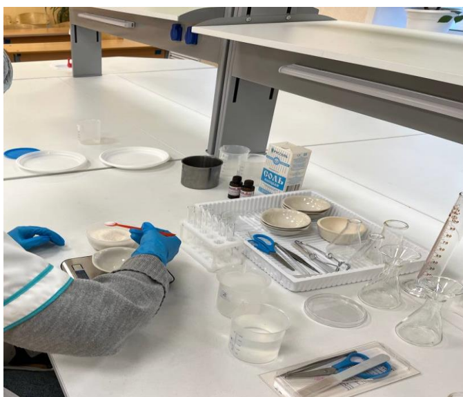
Фото 1. Приготовление раствора сахарозы.

Материалы и оборудование: корнеплоды свеклы, скальпели, бритвы, термометр со шкалой от -50 до +50 С, водяная баня, электрочайник, пробирки, штатив для пробирок, химические стаканы, линейки, пробочное сверло большого диаметра (8-10 мм), соль, снег или кубики льда, 12%-ный раствор глицерина, 1М и 2М раствор сахарозы, пипетки.