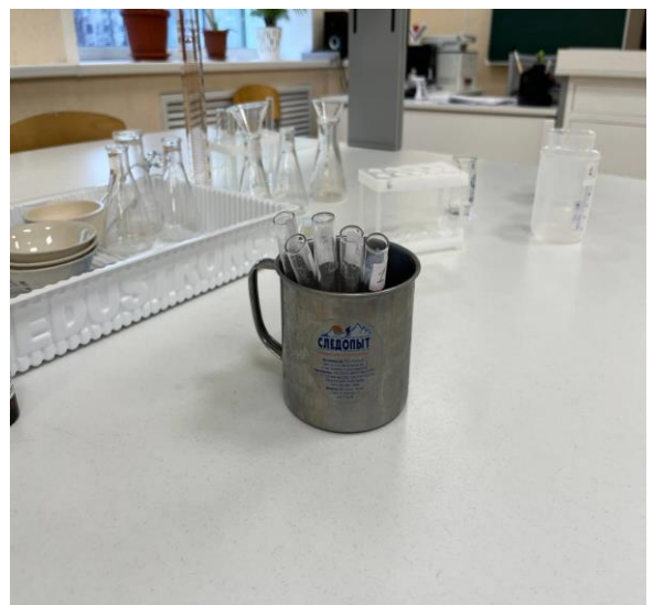
Фото 7 и 8. Замораживание и оттаивание пробирок.

Затем пробирки ставим в ёмкость с водой комнатной температуры для оттаивания, после чего сравниваем окраску раствора в пробирках. Данный опыт проделываем три раза.